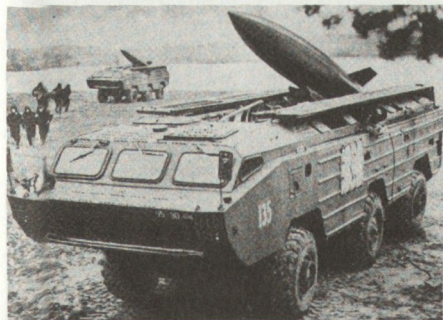
Lenkwaffensystem SS-21 SCARAB, Aufnahme aus der ZGT (Zentralgruppe der Truppen in der CSSR).

Den WAPA-Armeen unterstand bereits bisher eine mit dem System SCUD-B ausgerüstete Raketenbrigade. Ein Teil dieser Brigaden wurden bereits auf das weiterreichende moderne Lenkwaffensystem SS-23