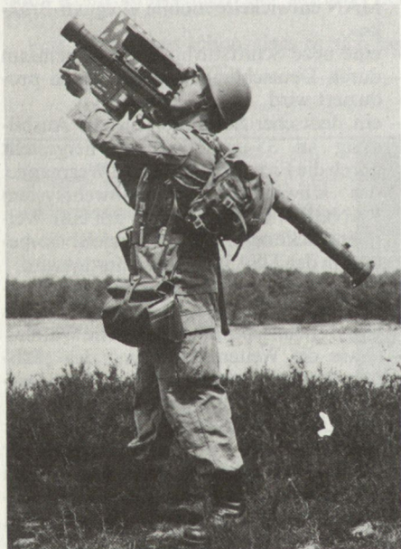
Schultereinsatz des Waffensystems STINGER

Die Berichterstattung über den Afghanistankonflikt und den Golfkrieg stellte das Waffensystem STINGER häufig in den Blickpunkt der Weltöffentlichkeit. Verschiedene Beiträge in der Fachliteratur haben die Leistungsfähigkeit dieses amerikanischen Einmann-Fliegerabwehrsystems hervorgehoben. Im nachfolgenden Bericht wird das anstehende europäische Nachbauprogramm für STINGER vorgestellt.