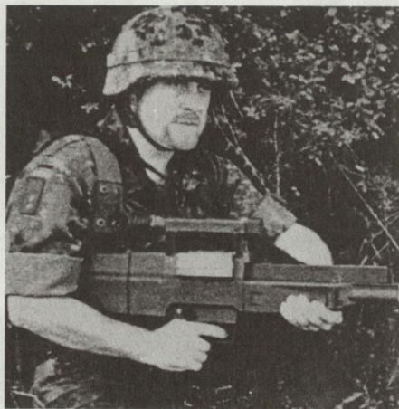
Deutscher Offizier mit dem neuen Sturmgewehr G 11.

Die bisherigen Resultate mit dem neuen Gewehr sollen sehr positiv ausgefallen sein. Bei Testschiessen sollen damit auf 300 m mindestens 80% Treffer erreicht worden sein, das heisst doppelt so viele wie mit dem