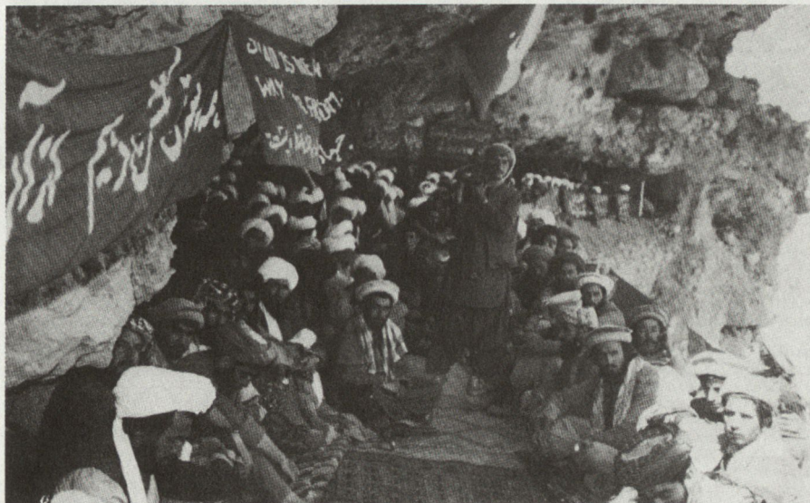
Koordinations-Versammlung von Kommandanten des innerafghanischen Widerstandes, die zu verschiedenen «Parteien» gehören.