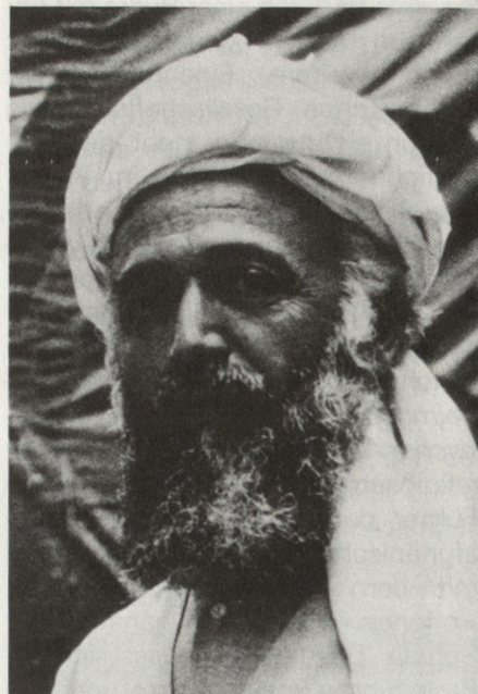
Burhanuddin Rabbani, Führer der sunnitischen Jamiat-e Islami.

gegenüber, und auch die saudische Wahabiten-Sekte versucht, mit grosszügiger finanzieller Unterstützung einzelner «Parteien», Sympathisanten zu gewinnen. Ein weiterer Grund für Meinungsverschiedenheiten ist der Gegensatz zwischen den vorwiegend paschtunischen «Parteien» und den Tadschiken, die vor allem Rabbani unterstützen.