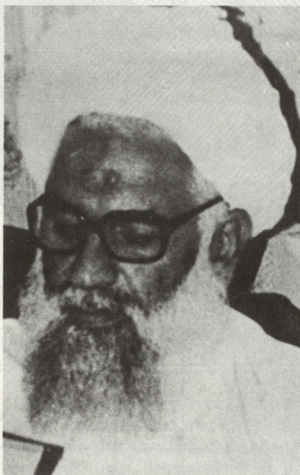
Ayatollah Mohseni, Führer der schiitischen Harakat-e Islami.

Die späteren Zwistigkeiten und Parteiabspaltungen sind zum Teil eine Folge des pakistanischen Einflusses auf die einzelnen Parteiführer, aber auch religiös begründet. Den Vertretern des traditionalistisch-gemässigten afghanischen Islam stehen die Anhänger der extremen Erneuerungsbewegung der Moslem-Brüder