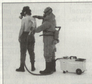
Zivilschutz-Einsatz (Dekontamination im Schutzzug)

Applikation. Verkürzte Behandlungszeiten bei gleichzeitiger Einsparung der Dekont-Lösung durch gezielte Direktapplikation sind das Resultat.