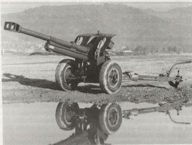
Rüstungsprogramm 91: 10,5-cm-Haubitze 46 mit gesteigerter Reichweite

durch Kampfwertsteigerung der Panzerabwehr-Lenkwaffen Dragon und Ersatz des Raketenrohrs durch die Panzerfaust;