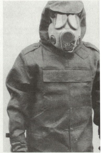
Standardausrüstung der ABC-Schutzeinheit: Neue Schutzmaske M-10M und kombinierter Schutanzug FOP-85.

Die eingesetzten tschechoslowakischen Soldaten waren als erste ihrer Streitkräfte mit der neuen Schutzmaske M-10M und dem kombinierten Schutanzug FOP-85 versehen. Beide Produkte stammen aus eigener tschechoslowakischer Produktion. Beim FOP-85 soll es sich um einen sogenannten Filtrationsschutzanzug, bestehend aus einem kohlestoffhaltigen Spezialgewebe, handeln. Die Leute des chemischen Zuges waren mit Anzügen des