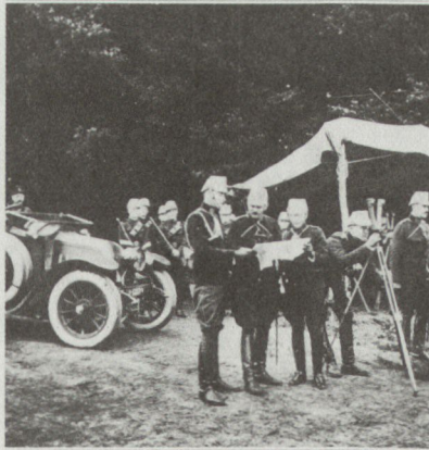
Helbing & Lichtenhahn

Die Epoche um den Ersten Weltkrieg 1907–1924