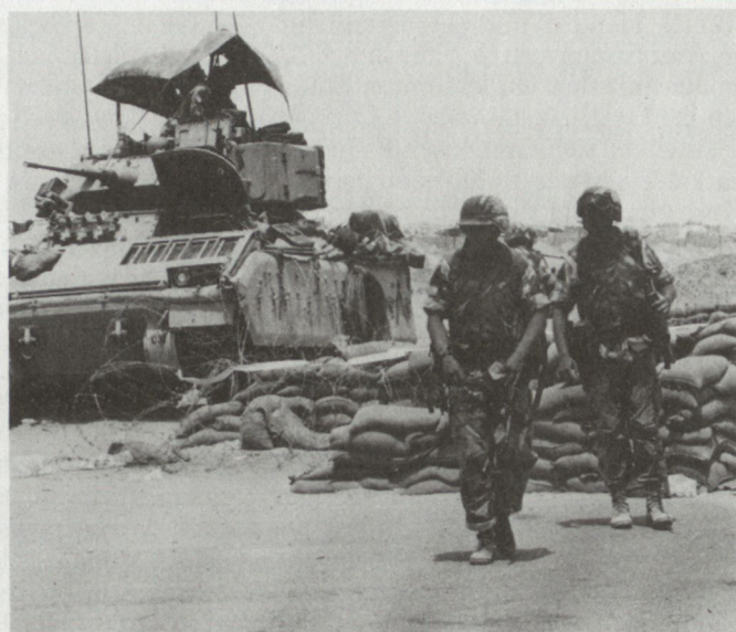
Die US-Rückhut im irakischen Grenzraum: letzter US-Posten der 3. US Pz Div nördlich von SAFWAN auf der Strasse Richtung BASRAH.