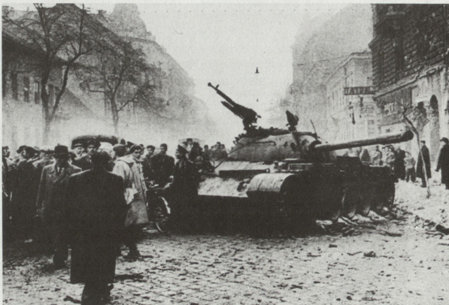
Ende Oktober 1956. Ein sowjetischer Panzer T-54, verlassen von seiner Besatzung, auf den Strassen von Budapest.

Am 3. November um 22.00 Uhr begann der zweite Teil der Verhandlungen der ungarischen Delegation mit den Sowjets, diesmal im Tököl. Auf Verlangen der Sowjets erschienen hier ungarischerseits General Maléter, Generalmajor István Kovács (Generalstabschef), Oberst i Gst Miklós Szücs (Chef der Op Abt des Gen Stabes) und Minister Ferenc Erdei als Regierungsvertreter. Malinyn war äusserst steif, beinahe unfreundlich. Die Besprechungen wurden nach einigen Minuten durch die Ankunft neuer «Gäste» unterbrochen. Generalleutnant Iwan Serow, der Chef des sowjetischen Staatssicherheitsdienstes (KGB) betrat mit 8 bewaffneten Unteroffizieren des KGB das Zimmer und verhaftete an Ort und Stelle alle anwesenden Ungarn – ungeachtet ihrer Person und ihrer diplomatischen