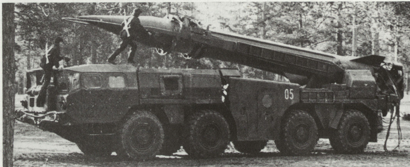
Mobile SCUD-B mit MAZ-543-Werferfahrzeug

dies ist sozusagen nur die Spitze des Eisbergs. Immer mehr zeichnen sich hier Entwicklungen ab, mit denen die veralteten unpräzisen Sowjetraketen nicht mehr Schritt halten könnten.