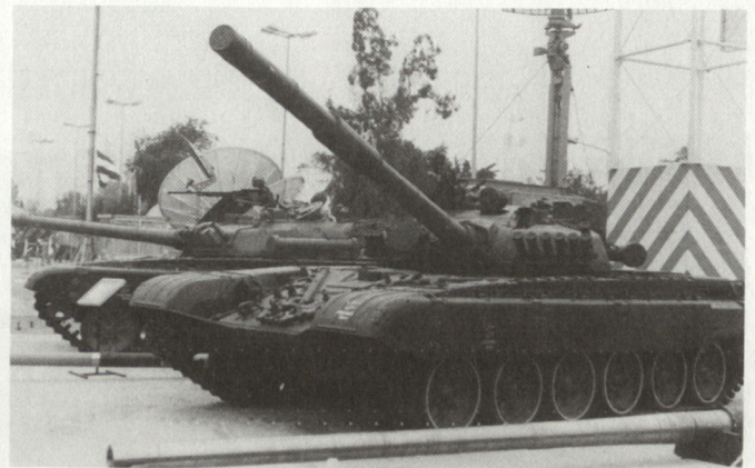
Modifizierte sowjetische Waffen für die IRQ-Streitkräfte. Links Schützenpanzer BMP-1, rechts Kampfpfanzter T-72.

nierten, und ebensowenig hat die irakische Armee alle ihre ausgefeilten Waffensysteme überhaupt benutzt. Der grösste Teil des Kampfes wurde schlicht mit massivem Feuer geführt, und dabei wurde tagelang eine Unmenge Munition verschossen.