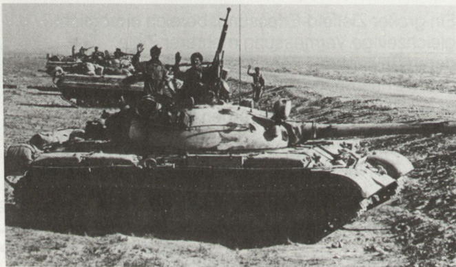
Mechanisierte Truppen mit Kampfpanzer T-55.