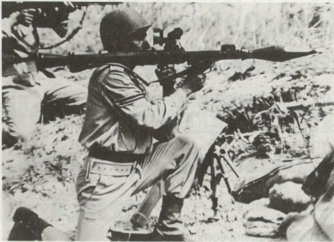
Infanterist mit Rak-Rohr RPG-7.