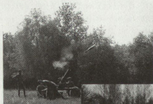
Mortar 120 mm