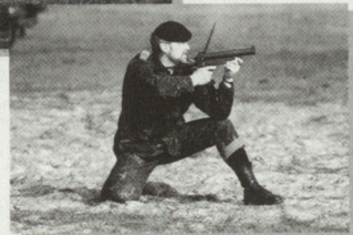
40 mm Grenade-Pistol