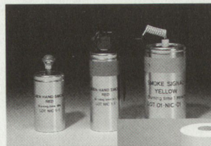
Coloured Smoke Grenades