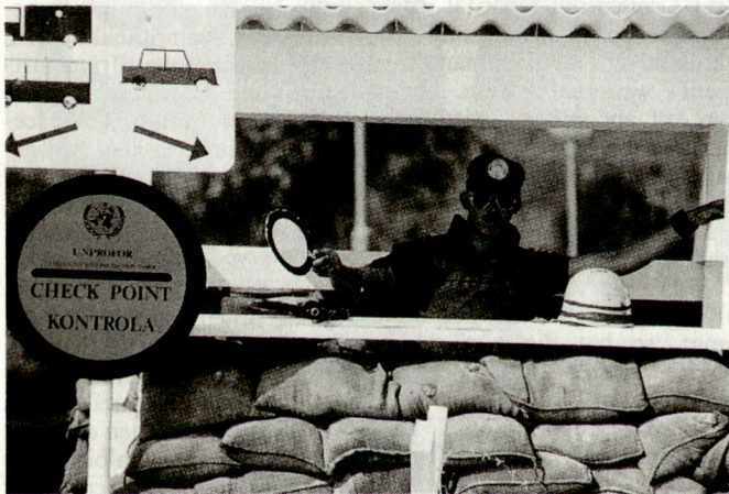
Belgischer UNO-Soldat in Kroatien. Trotz Reduktion der Streitkräfte soll das belgische Engagement für friedenserhaltende Missionen weiter verstärkt werden.

Im Zuge der Verkleinerung der belgischen Armee hat Verteidigungsminister Delcroix auch Kürzungen bei den Beschaffungsvorhaben angekündigt. Diese sollen insbesondere