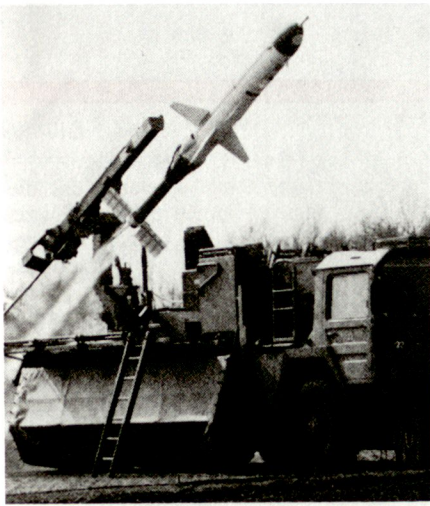
Das Drohnensystem CL-289 wurde auf der Basis der auch im Golfkrieg eingesetzten CL-89 entwickelt.