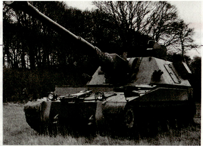
Prototyp der neuen britischen Panzerhaubitze 155 mm AS90, deren Auslieferung an die Royal Artillery kürzlich begonnen hat.

Bis zum Herbst dieses Jahres soll nun aufgrund der beschlossenen Vorgaben vom belgischen Generalstab eine Studie über die neue Truppenstruktur ausgearbeitet werden. Darüber hinaus prüft die politische Seite, ob anstelle der Wehrpflicht eine allgemeine Dienstpflicht für alle (junge Männer und Frauen) treten soll. hg