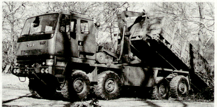
Wichtig ist die zeitgerechte Bereitstellung der Munition in der Nähe der vorgesehenen Stellungsräume. Angewandt wird das Munitionsversorgungssystem DROPS.

Diese B27-Studie kam zum Schluss, dass eine optimale Auflockerung sowie ausreichende Tarnung und Mobilität notwendige Voraussetzungen zur Gewährleistung der eigenen Konterbatteriefähigkeit bilden. Diese Erkenntnisse waren die Grundlage für das