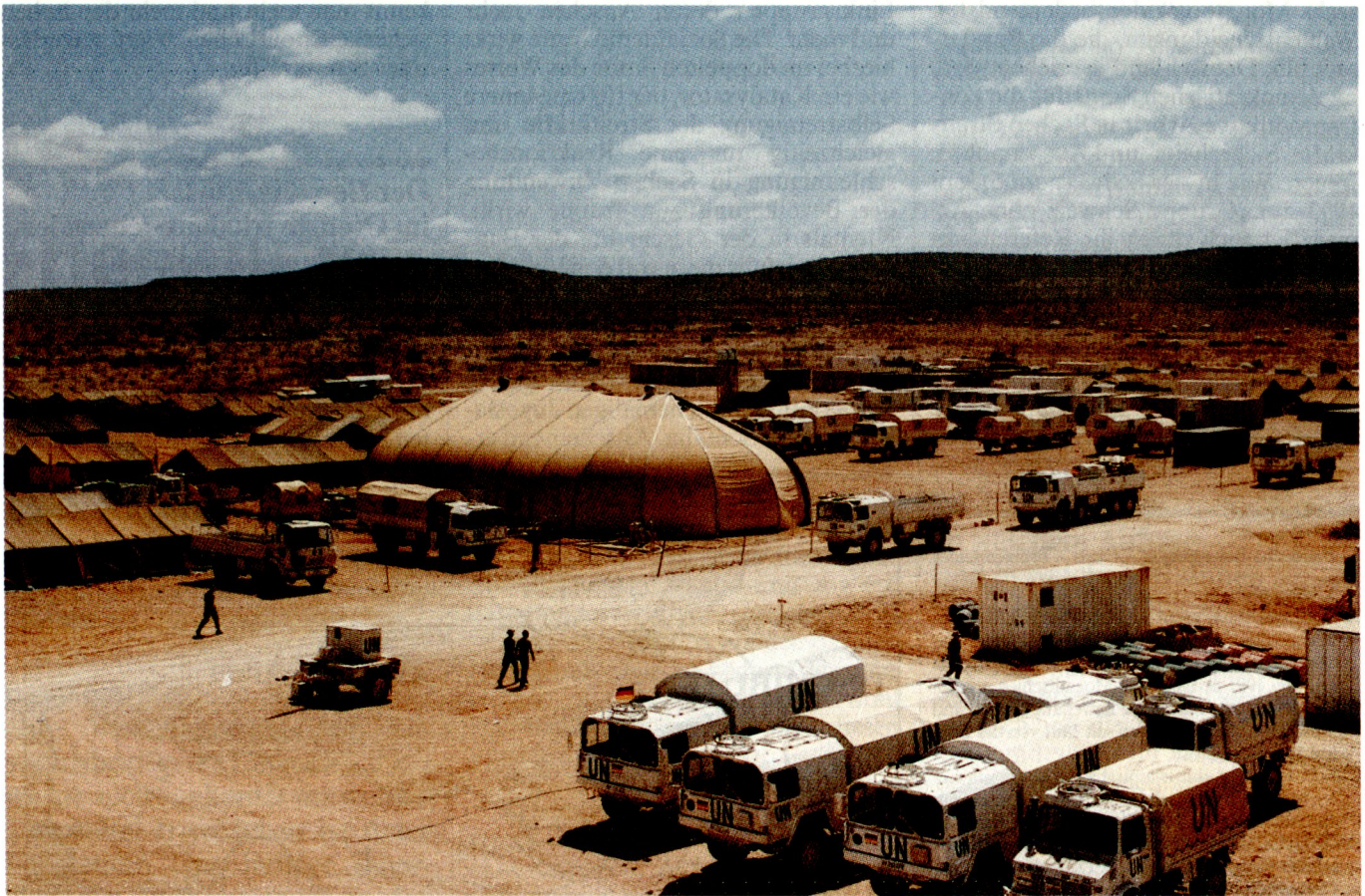
Versorgungsbereich des deutschen Lagers am Stadtrand von Belet Uen. In der Mitte Kühlzelt für die Trinkwasserbehälter. (BMV)

schen Sinne betriebenen «Menschenrechtsimperialismus» ab. Was tut aber die Bundeswehr wirklich, nachdem die deutsche Regierung im vergangenen Jahr wiederholte Male vom UN-Generalsekretär Butros Butros Ghali um Unterstützung gebeten wurde?