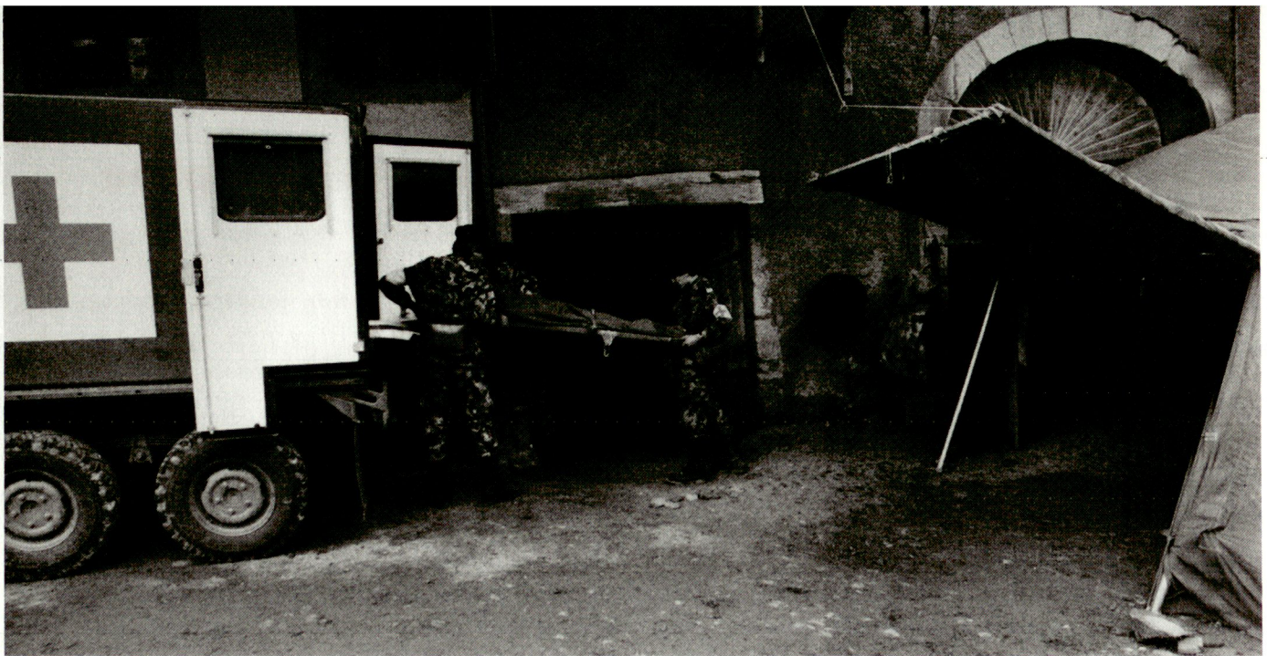
Es ist Aufgabe der Sanitätshilfsstelle, den Patienten transportfähig zu machen

Ablehnung gegenüber der Armee. Die Anzahl der zwar diensttauglichen, aber nicht dienstfähigen AdA scheint in den Auszugsformationen, im Gegensatz zu den Rekrutenschulen, rückläufig zu sein. 3