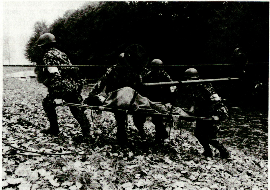
Seilbahn 88

Während dem Sanitätsdienst der Armee insgesamt genügend AdA zur Verfügung stehen, fehlt jedoch eine beträchtliche Anzahl an Ärzten v.a. in den Auszugsformationen. Eine Um-