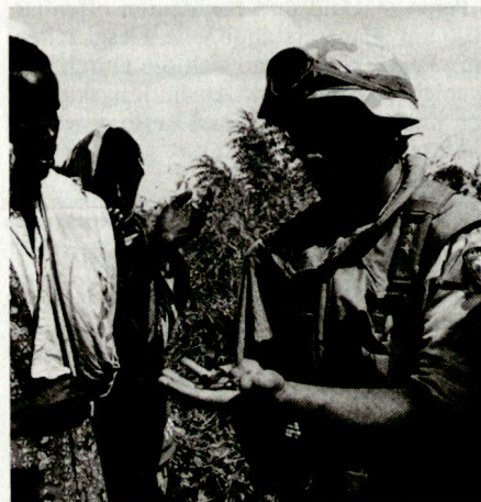
Italienische Truppen im Auslandseinsatz, mit Priorität muss heute die persönliche Ausrüstung der Soldaten modernisiert werden.

gedacht, doch wurde man trotzdem von neuen Fakten überrascht. Da sind einmal der Krieg im östlichen Nachbarland Italiens, die Möglichkeit von Flüchtlingsströmen aus jenen Gebieten; ausserdem ist die Lage in Nordafrika unklar. Italien ist auch am ungehinderten Schiffsverkehr in der Strasse von Sizilien interessiert. Im Mittelmeer, das zu seiner Interessenssphäre zählt, sind die frühere sowjetrussische Armada, aber auch grosse Teile der befreundeten 6. US-Flotte verschwunden. Zu all diesen Fakten kommen permanente finanzielle Restriktionen im Aufbau und Unterhalt der Streitkräfte hinzu. Einsätze von Streitkräften ausserhalb Italiens in Mozambique, Alba-