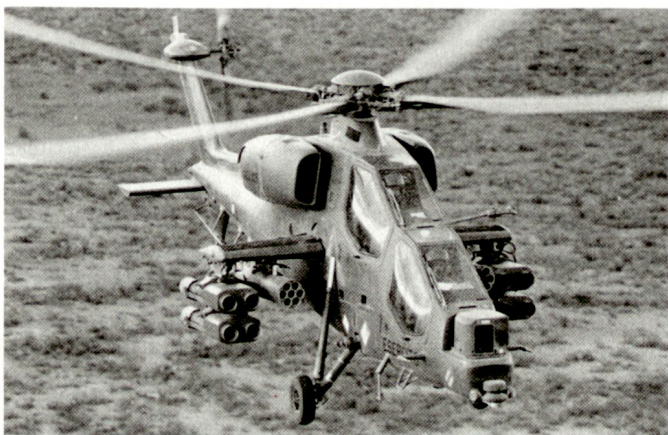
Die fehlenden finanziellen Mittel verunmöglichen die Einführung neuer Waffensysteme (Bild: Kampfhelikopter A-129 Mangusta) bei den italienischen Streitkräften.