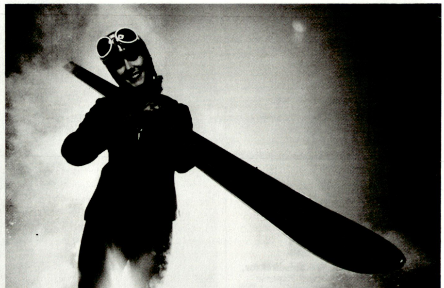
Ski-Kern für die Weltmeister