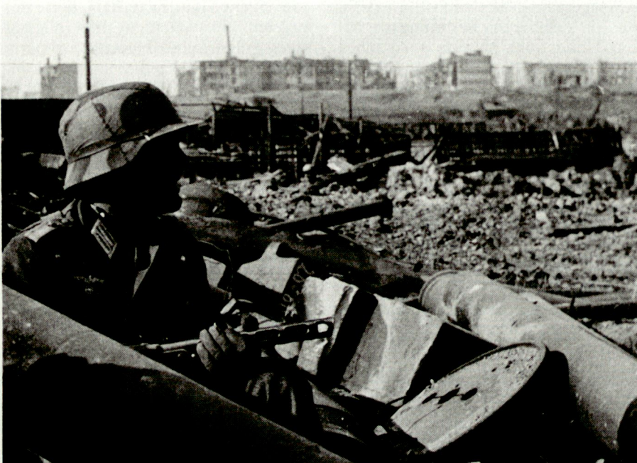
Oft wird der Kampf in den Ruinen im Einzelgefecht geführt.*

Sinngemäss führte F. Paulus aus, dass für die Zeit von Weihnachten 1942 bis zum Grossangriff der Russen am 10. Januar 1943 bezeichnend gewesen sei, dass einerseits der 6. Armee immer noch und immer wieder die Befreiung mit Bestimmtheit in Aussicht gestellt wurde, und dass andererseits die Armeeführung im Kessel sich nach wie vor mit Überlegungen und Massnahmen hinsichtlich eines Ausbruchs befasste. Der Niedergeschlagenheit von Ende Dezember folgte keineswegs eine völlige Resignation. Zu dieser Tatsache hat beigetragen, dass dem Armeoberkommando die sogenannte