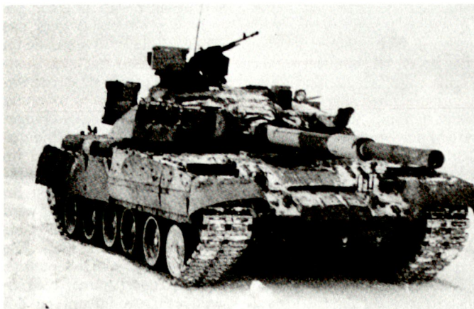
Zur Ausrüstung der ukrainischen Landstreitkräfte gehören auch modernste Waffensysteme wie Kampfpanzer T-80UD.

Das Beispiel Ungarn zeigt aber deutlich auf, dass Umstellungen auf westliche Rüstungsgüter in den ehemaligen Staaten des WAPA aus wirtschaftlichen und politischen Gründen kurzfristig kaum realisierbar sind. hg ■