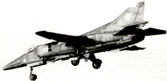
Die ungarischen Luftstreitkräfte verfügen über 28 neue MiG-29; daneben über Kampfflugzeuge MiG-21 und MiG-23, die teilweise modernisiert werden sollen.

Der erste Entwurf für eine neue Einsatzdoktrin, formuliert durch das Verteidigungsministerium in Kiev, wurde vom Parlament bisher nicht akzeptiert. Es scheint, dass sich die Ukraine mit der Formulierung einer eigenen Verteidigungsstrategie und -doktrin für die Armee sowie auch mit der Definierung neuer Streitkräftestrukturen schwer tut. hg