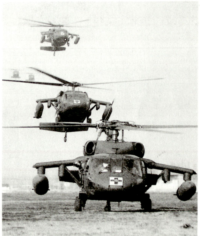
Spezialhelikopter UH-60 für Sanitätstransporte bei der Landung auf Camp Darby/Livorno. Sie kommen aus Deutschland und fliegen nach Somalia weiter.

Das SETAF-Fallschirmjäger-Bataillon (3/335 Infantry Airborne) ist das grösste der ganzen US Army (1000 Mann), da es selbständig operieren oder in einen multinationalen Verband eingegliedert werden kann. Es verfügt deshalb über eine Geniekomponente, über Sanitätstruppen, über eine Artillerie-Batterie mit sechs 105-mm-Geschützen und ist in der Lage, einen Brückenkopf zu bilden und zu halten, bis umfangreichere Kräfte an Ort und Stelle sind.