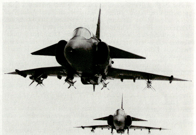
Abfangjäger JA-37 Viggen werden laufend dem neusten technischen Stand angepasst. Ab 2002 wird die Sollstärke der Flygvapnet noch aus 8 Viggen- und 8 Gripen-Staffeln bestehen.

den gelegenen Base von Satanas stationiert. Gleichzeitig werden die dort gegenwärtig noch vorhandenen zwei Geschwader Viggen aufgelöst oder auf einen anderen Stützpunkt verlegt. Das Gleiche ist für das Geschwader F13 von Norrköping vorgesehen, deren Abfangjäger JA-37 Viggen das Geschwader F17 von Ronneby verstärken, während die Aufklärer SF-37/SH-37 Viggen zum F10-Geschwader von Ängelholm stossen werden. Das Geschwader F6 von Karlsborg wird wiederum eine Staffel Viggen dem F15-Geschwader von Soderhamn abgeben, während die zwei übrigen Viggenstaffeln ausser Dienst gestellt werden. Bis zum Jahr 2002 wird Schwedens Luftwaffe noch