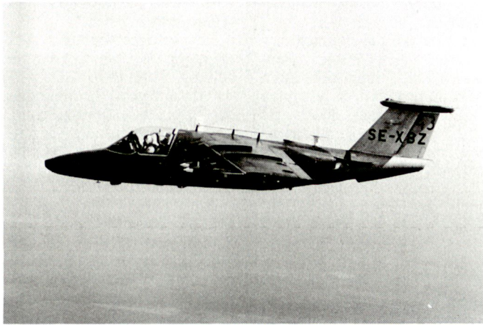
Von den 144 noch flugtüchtigen SK60 (S-105) werden 115 mit neuen Schubstärkeren Triebwerken ausgerüstet.

über eine Sollstärke von 16 Staffeln verfügen, davon wird die Hälfte mit Gripen, der Rest mit JA-37 Viggen-Abfangjägern ausgerüstet sein.