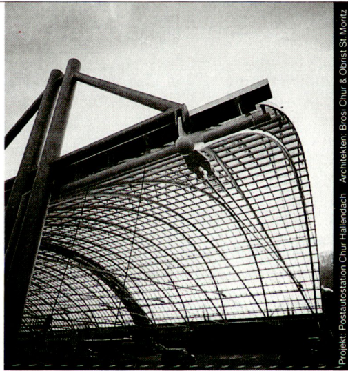
Projekt: Postautostation Chur Hallendach Architekt: Brosi Chur & Obrist St. Moritz

Stahl-Glas-Konstruktionen in architektonisch perfekter Vollendung verwirklichen wir mit innovativen Ideen und höchsten Anforderungen an Materialien und Ausführung.