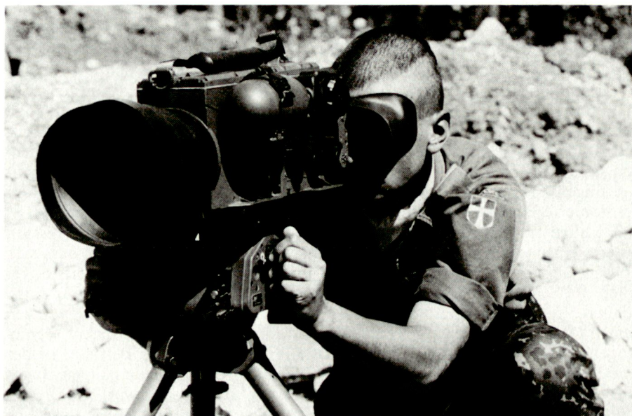
Kalibrierung eines Nachtsichtgerätes für Beobachtungsaufgaben in der Dunkelheit. Dänischer Blauhelmsoldat in der UNPROFOR (Ex-Jugoslawien).

Die UNO ist an allen Staaten interessiert, die Blauhelmsoldaten entsenden, welche die übernommenen Aufgaben zuverlässig erfüllen. Dies ver-