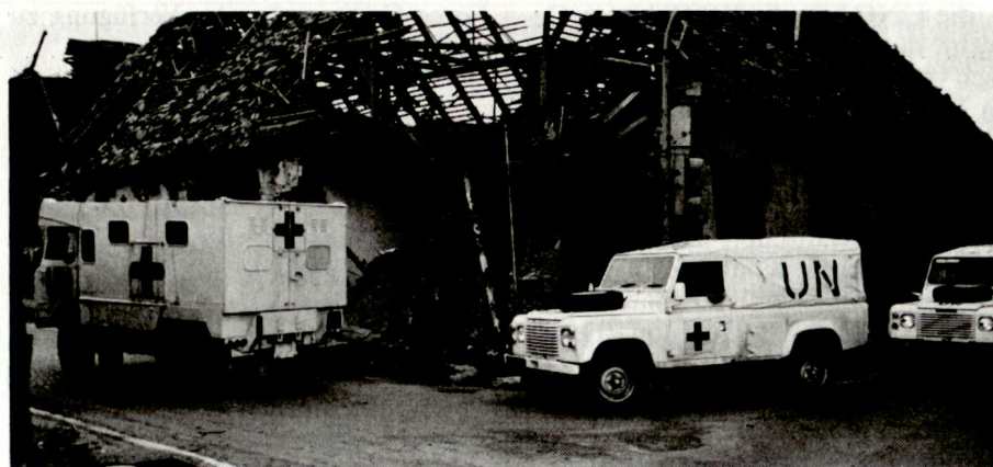
Ambulanzen des britischen Kontingents auf der Fahrt durch Vukovar (UNPROFOR).

Blauhelmtruppen arbeiten in engem Kontakt mit der Zivilbevölkerung