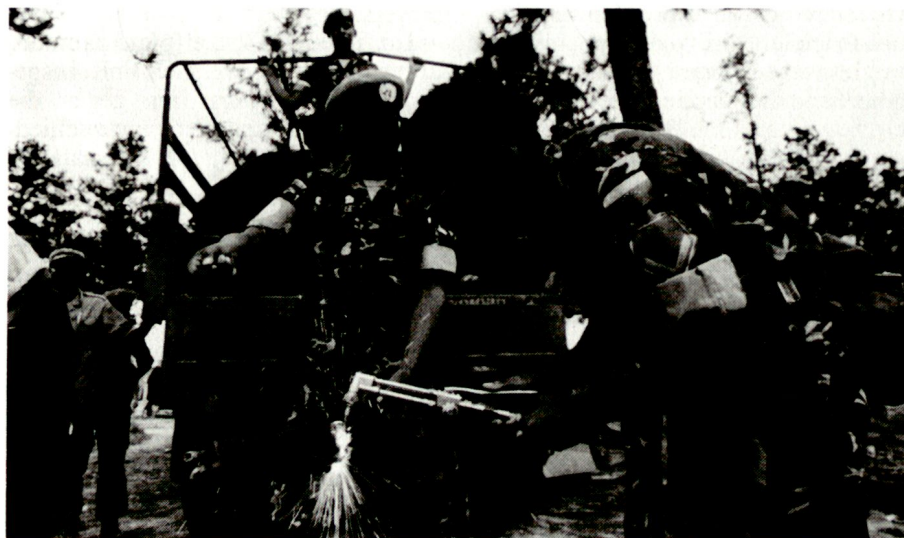
Zerstörung von Waffen, welche die Blauhelme beschlagnahmt haben. Soldat aus Venezuela in der ONUCA, Nicaragua.

Der Verfasser dankt den Herren lic. iur. G. Buletti (Generalsekretariat EMD), Dr. A. Thalman (Eidg. Departement für auswärtige Angelegenheiten) und lic. rer. publ. R. Diethelm (Hochschule St. Gallen) für wertvolle kritische Bemerkungen zum Argumentarium. ■