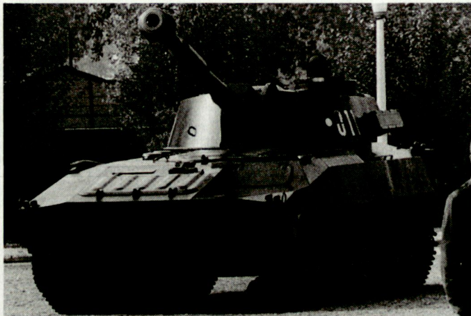
Die ungarischen Streitkräfte haben mit akuten finanziellen Problemen zu kämpfen. (Bild: Panzerhaubitze 2S1, die in Ungarn in Lizenz hergestellt wird.)

In diesem Konkurrenzkampf soll das KGB heute über die besseren Voraussetzungen verfügen; Hauptgrund dafür seien die grösseren verfügbaren finanziellen Mittel. Zudem werden KGB-Offiziere wesentlich besser bezahlt. Allerdings, so wird festgehalten, wird dieser Konkurrenzkampf bewusst weiter gepflegt, weil diese Situation zu einer aktiveren und gezielteren Nachrichtenbeschaffung führe. hg ■