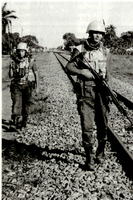
Die Diskussionen um neue Streitkräftestrukturen in Italien gehen weiter. (Bild: Italienische Soldaten in Mozambique).

Hiefür genügen – nach Ansicht der PDS – 145 000 Mann statt der bisherigen 379 000 Mann sowie 314 000 Reservisten. Details werden nur wenige angegeben, dagegen bestehen Vorstellungen über die Beschneidung der Ausrüstung. Nebst Berufsmilitär sollen Freiwillige dienen (jährlich 17 000). Die allgemeine Wehrpflicht würde abgeschafft; im Kriegsfall müsste zusätzlicher Dienst geleistet werden. Ein Zivildienst von drei bis sechs Monaten Dauer ist ebenfalls vorgesehen.