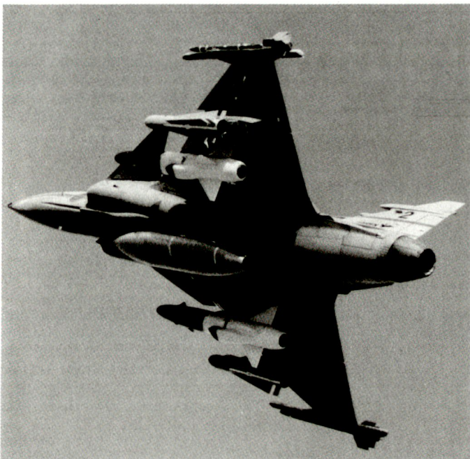
Zusammen mit British-Aerospace will Schweden neue luftgestützte Lenkwaffen u.a. auch für den JAS-39 Gripen (Bild) entwickeln.