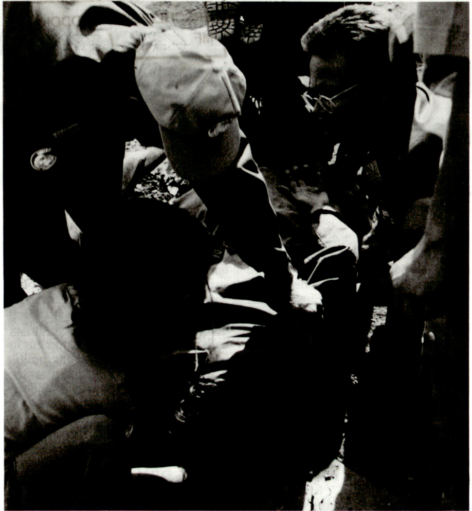
Eine Sanitätsequipe der «Swiss Medical Unit» während der Operation MINURSO (Mission des Nations Unies pour le référendum au Sahara occidental) in der Westsahara im Einsatz.

Blauhelmeinsätze, wie sie unser Gesetz vorsieht, stehen in der bewährten Tradition unserer guten Dienste. Sie sind eine konsequente und zeitge-