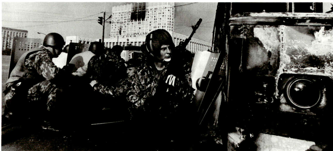
Die europäischen Öffentlichkeiten sehen keine Bedrohung durch einen möglichen Grosskonflikt. Interne Konflikte werden als lokales oder regionales Ereignis verdrängt. Bild: Moskau, 4. Oktober 1993. Angehörige einer russischen Spezialeinheit gehen hinter einem ausgebrannten Bus in Deckung. Im Hintergrund das brennende russische Parlamentsgebäude.

Insgesamt werden diese Leitvorstellungen auch die sicherheitspolitische Kooperation der kommenden Jahre sowie die Anstrengungen zur Einhaltung der eingegangenen Verpflichtungen bestimmen. Sie ermöglichen es uns, unsere als verlässlicher, konstruktiv und sachkundig mitwirkender Sicherheitspartner universell und regional auszubauen.