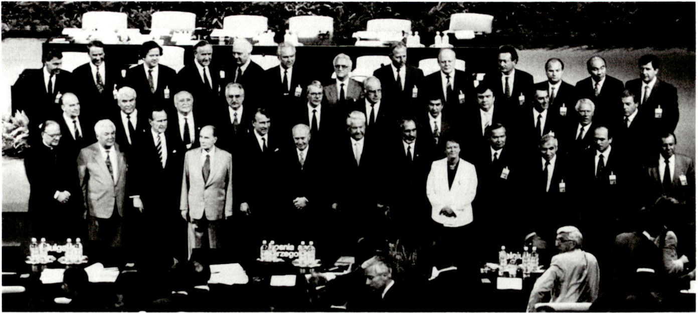
Gruppenbild der Spitzenvertreter der 51 Mitgliedstaaten am KSZE-Gipfeltreffen 1992 in Helsinki.

Im Rahmen dieser umfassenden Code of Conduct-Verhandlungen glauben wir unseren und den gesamt-europäischen Stabilitätsinteressen dadurch am besten dienen zu können, dass wir zur raschestmöglichen Herstellung gemeinsamer demokratischer, ökonomischer und sicherheitspolitischer Standards im gesamten KSZE-Raum beitragen und die Fähigkeit der KSZE zur kollektiven Solidarität stärken, ausgehend davon, dass die NATO das Kerngebilde eigentlicher militärischer Sicherheitsgarantie bleiben soll.