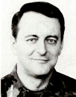
Edwin Ebert, Divisionär, Waffenchef der Übermittlungstruppen; Direktor des Bundesamtes für Übermittlungstruppen (BAUEM); Übermittlungschef der Armee (UCA) und Beauftragter des Bundesrates für die Koordinierte Übermittlung im Rahmen der Gesamtverteidigung (KUemGV), 3003 Bern.

Die Gründe für diesen Nachholbedarf sind die heutigen Anforderungen an die Führung des Gefechts, Einsatzdoktrin der «Armee 95», Technologiewandel in der Elektronik.