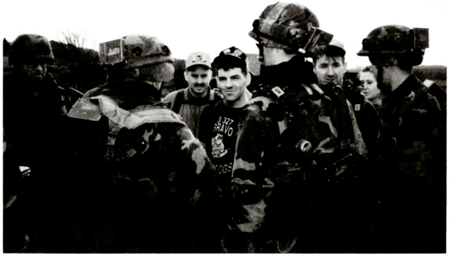
US-Soldaten in Verhandlung mit «Dorfbewohnern» (Figuranten).

Es galt, einen UNO-Konvoi zu einem bestimmten Punkt zu eskortieren, wo unter UNO-Aufsicht ein Ge-