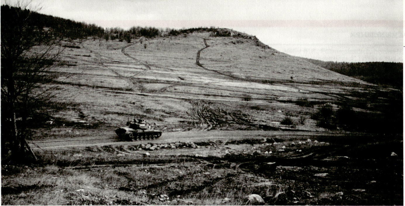
ROT (mit M-60) im Anmarsch. Im Hintergrund der «VIP-Hill».

um die Daten zu sichten, zu bewerten und zu verdichten. Ob das getan wird, blieb letztlich unklar. Vielleicht bleibt es oft dabei, dass die Truppe ein die wichtigsten Daten enthaltendes «take home package» erhält und die Nachbearbeitung selbst vornehmen muss.