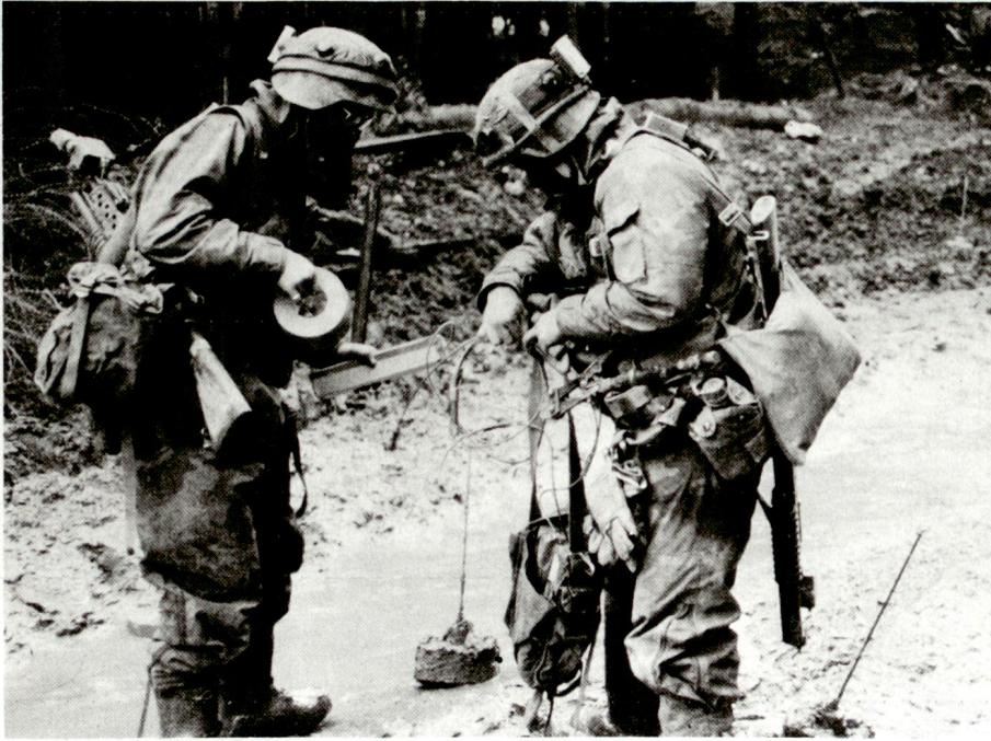
US-Soldaten bei Entminungsarbeiten.

Der Übungsplatz war so eingerichtet, dass jeweils stufengerecht alle Ausbildungsschritte durchlaufen werden konnten. In der Zeit, in der die Stufe Bataillon auf dem taktischen Simulator beübt wurde, fand die Ausbildung auf dem Schiessimulator statt. Danach wurden die Kampfvorbereitungen im Gelände ergänzt und erste Zugs- und Kompanieübungen durchgeführt. Nach deren Abschluss wurde das ganze Bataillon in einzelnen Übungen in freier Führung auf dessen Kampftauglichkeit hin überprüft.