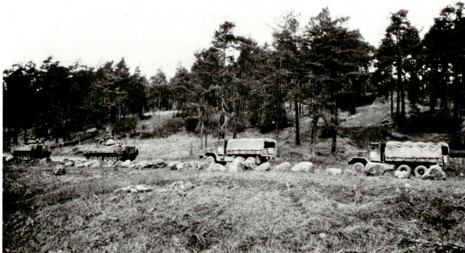
UN-Konvoi mit Eskorte.

Nach der Durchfahrt des Vorausdetachements sperrten die Freischärler die Strasse erneut, diesmal mit Stacheldraht. Die Nahsicherung des Konvois fuhr auf das Hindernis auf und stieg aus, um es beiseite zu räumen. In diesem Moment eröffneten die Freischärler das Feuer. Der Konvoi war blockiert, seine Spitze lag unter Beschuss. Es dauerte etwa zehn Minuten, bis ein Bradley des Vorausdetachements zurückkam und den Kampf aufnahm. Der Schützenpanzer fuhr in den Wald und vernichtete den Gegner mit seiner 25-mm-Kanone auf ca. 50 Meter Distanz. Die Kanone feuerte, bis alle Freischärler getroffen waren. Es entbehrte nicht der Grausamkeit, als die Schnellfeuerkanone gnadenlos auf die Freischärler in ihrem Erdloch schoss. Die Übung zeigte klar, dass der UNO-Einsatz ohne kampfkraftige Sicherung an einer Gruppe leichtbewaffneter Irregulärer gescheitert wäre.