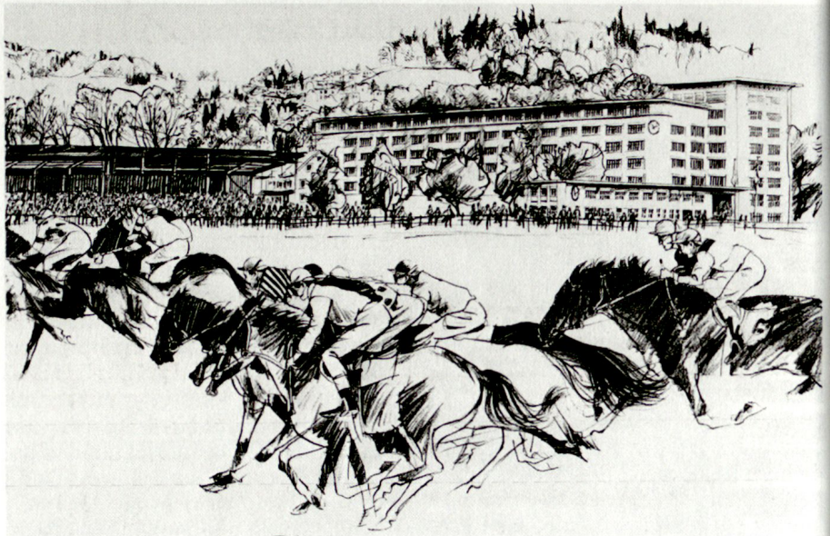
Wo Militär, Sport und Zirkus friedlich vereint sind: Die Luzerner Allmend.

Die gemeinsame Projektarbeit von Bund, Kanton und Stadt Luzern ist ausgezeichnet angelaufen. Die Luzerner Behörden sind bereit, alles dazu beizutragen, dass das Projekt im vorgesehenen Zeitrahmen realisiert werden kann.