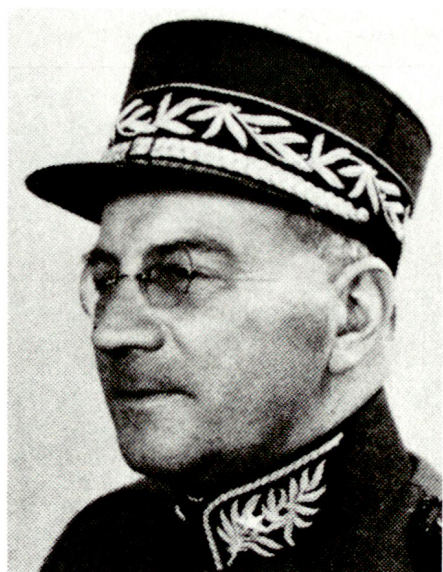
Edgar Schumacher (1897–1967) von Rüscheegg (BE) war 1945 und 1946 Kommandant der Zentralschulen. Von 1947 bis 1956 kommandierte er die Felddivision 6.

von Oberstleutnants zu Regimentskommandanten geschaffen. In den fünfziger Jahren wurden diese Kurse zur Zentralschule III-A. Am Ende des zweiten Weltkrieges wurden die Gruppe für Ausbildung sowie das Kommando der Zentralschulen gegründet. Auf Beginn des Jahres 1945 wurde Oberst Schumacher als Kommandant der Zentralschulen gewählt und der Hauptabteilung III, Truppengattungen, unterstellt. Die Kurse für Nachrichtenoffiziere und Adjutanten wurden im Laufe der Jahre in Technische Schulen I und II und Technische Kurse (TK) für Nachrichtenoffiziere