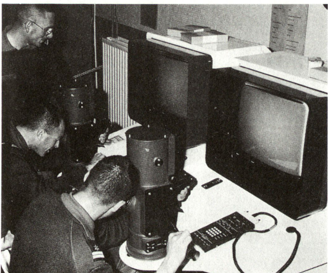
Simulatoren für die Ausbildung an Wärmebildgeräten.

Einsätze ausserhalb der NATO werden ausgelöst durch