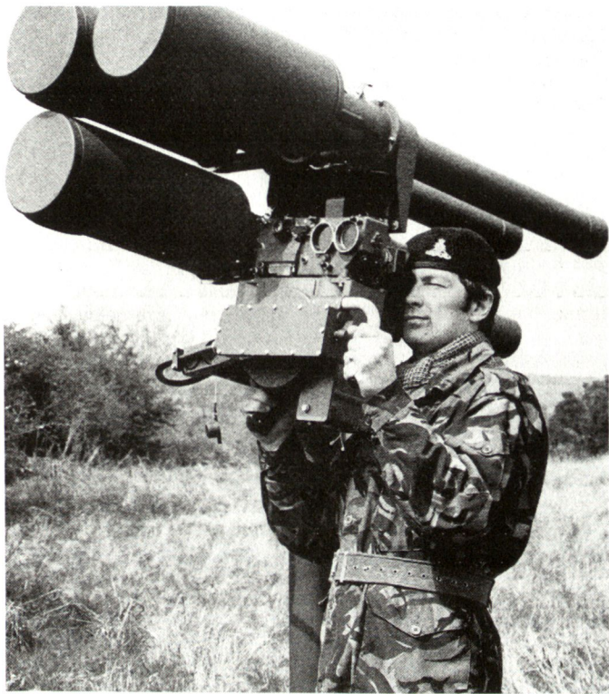
Das britische taktische Flab-Lenkwaffensystem Starburst, das u.a. auch durch Kuwait beschafft wird.

gemeinsamen Machbarkeitsstudie entwickelt wurden (Lenkwaffe, Werfer, Radar, Optronik, EGM, Steuerung, Übermittlung usw.). Einzig die Interoperabilität muss in jedem Fall gewährleistet sein.