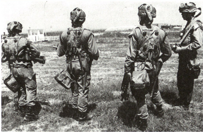
Infanteriegruppe, ausgerüstet mit Schiesssimulatoren für die taktische Gefechtsausbildung.

die Resultate zu erfassen und um den Teilnehmern zu gestatten, Verbesserungen anzubringen.