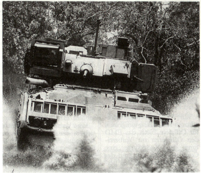
Nicht-letale Waffen zur Unterstützung militärischer Wirkung, wie z.B. der mobile Blendlaser Stingray, dienen primär der Ausschaltung gegnerischer Ziel- und Beobachtungsgeräte sowie von Optiken und Sensoren.

Um Kraftwerke ausser Betrieb zu setzen, hat man an den Abwurf grosser Mengen von Karbonfiber-Fäden gedacht, um Kurzschlüsse bei den austretenden Leitungen zu provozieren. Dies könnte äusserst negative Auswirkungen auf die gegnerische Infrastruktur ha-