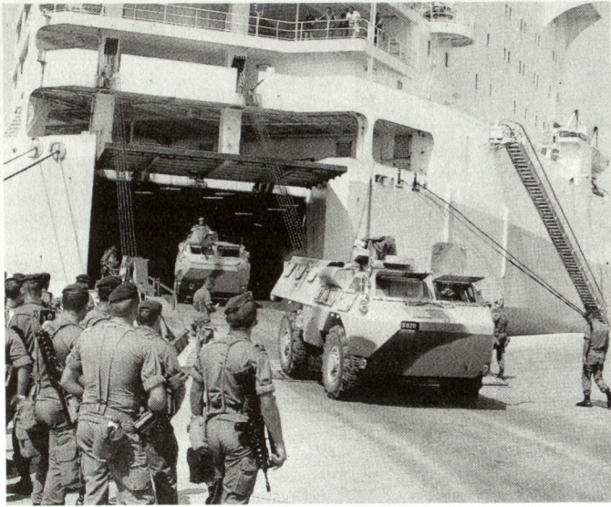
Für Operationen ausserhalb des NATO-Raumes werden neue Transport- und Führungsmittel benötigt.

eine Bedrohung nationaler Sicherheitsinteressen, die nicht direkte Bedrohung eines NATO-Landes bedeuten müssen. Für die Verteidigungsaufgabe haben wir uns an die Einstimmigkeit in der Allianz gewöhnt. Für die neuen Einsätze entscheiden jedoch die einzelnen NATO-Länder selbständig, ob und evtl. wie sie sich an einer Operation beteiligen wollen.