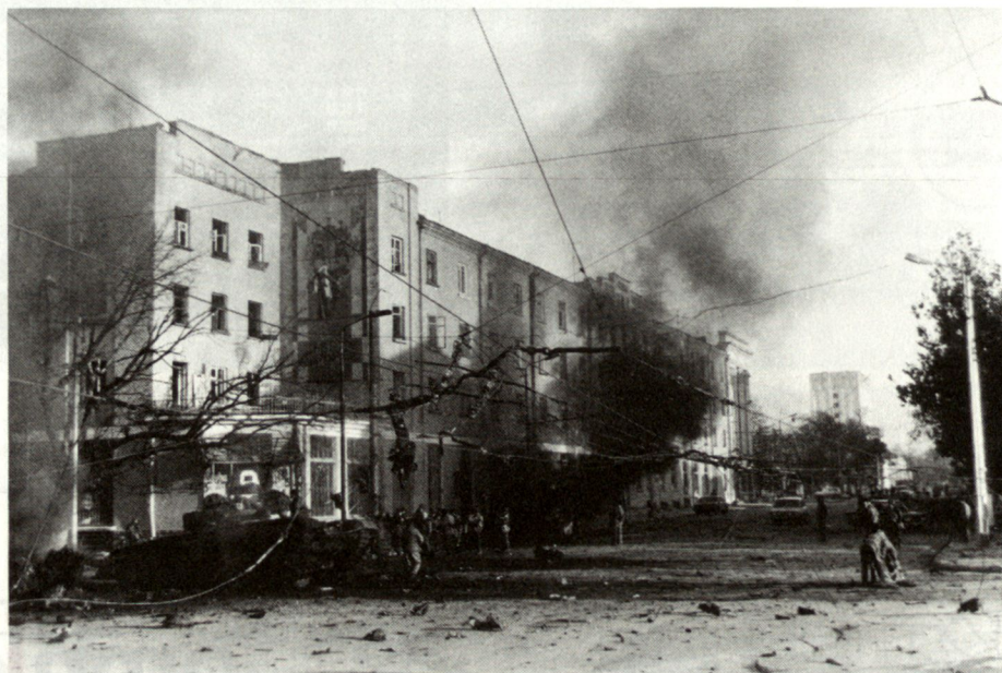
Grosny, 27. November 1994: Besonders hart trifft der russische Angriff die tschetschenische Zivilbevölkerung. Zerstörte Infrastruktur und brennende Fahrzeuge prägen das Strassenbild.