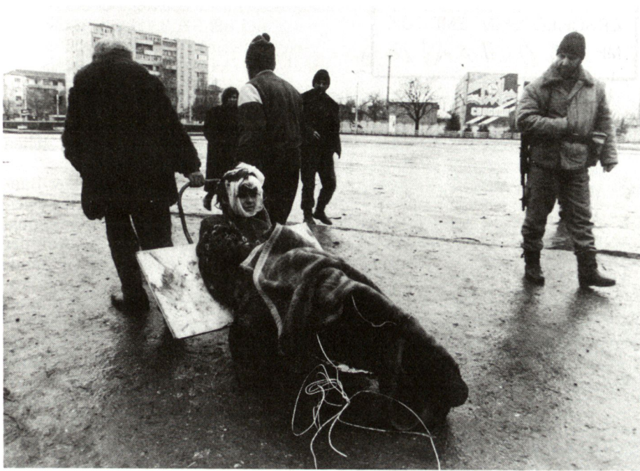
Grosny, 8. Januar 1995: Zivilisten mit einem schwerverletzten tschetschenischen Jugendlichen auf der Suche nach medizinischer Versorgung. Folgen eines russischen Artillerieeinsatzes.

ihre Geschäfte auch mit Regierungen, deren Verhalten sie nicht gutheisst. Wer mit Flugzeugen, Artillerie und Panzern auf die eigene Bevölkerung schießt, wer ohne mit der Wimper zu zucken internationales und nationales Recht verletzt, ist allerdings kein verlässlicher Partner. Sicherheit gibt es, entgegen einem vielgehörten Wort, nicht mit ihm, sondern nur gegen ihn. Man täusche sich nicht. Missachtung des Rechts destabilisiert und gefährdet auch uns.