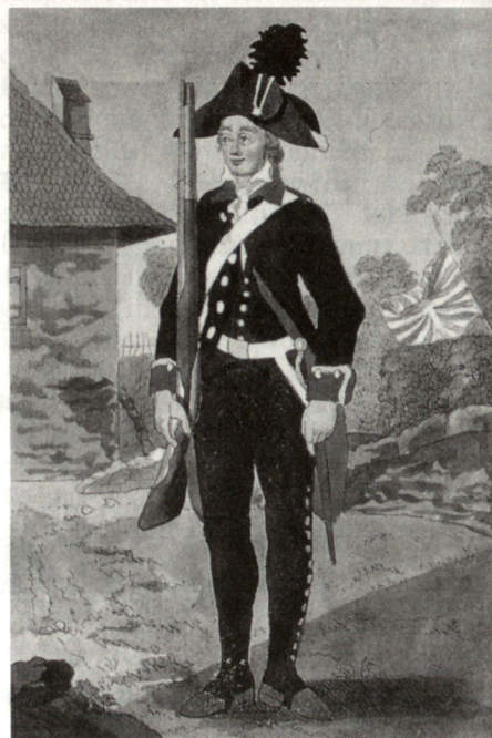
Zürcher Kanonier in zeitgenössischer Uniform (1792).

Die «Aufständischen» behaupteten, nicht den Sturz der Regierung zum Ziel, sondern keine anderen Absichten gehabt zu haben, «als die Ruhe und Glückseligkeit des ganzen Vaterlandes zu erhalten». Sie verlangten zur Beurteilung ihrer Forderungen ein eidgenössisches Schiedsgericht, was ihr angebliches Vertrauen in die eigene Obrigkeit doch beträchtlich relativiert. Die Zürcher Regierung sah nicht ein, warum in ihrem nach ihrer Ansicht wohlfunktionierenden Staatswesen etwas zu ändern sei und befürchtete insbesondere die Gefahr der französischen Einmischung und Invasion. Die Obrigkeit kam zur Überzeugung, dass die von den Unruhestiftern angerufenen Urkunden (Waldmannscher Spruchbrief von 1489, Kappelerbrief von 1532) ein blosser Vorwand gewesen seien und setzte diese kurzerhand ausser Kraft. Die Briefe seien «durch Gewalt und im Zustand einer Rebellion der Obrigkeit abgerungen worden, und passten keineswegs mehr für die neueren Zeitumstände.» Ziel des Memorials sei es gewesen, «die Verfassung unseres Vaterlandes umzu-