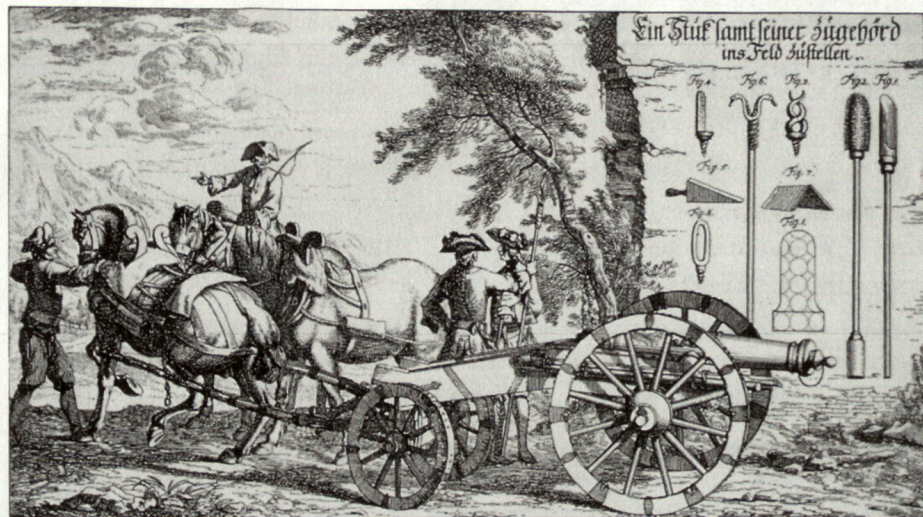
Total wurden 4095 Mann mit 12 Kanonen (!) und 224 Pferden für den Ordnungsdienst 1795 in Stäfa eingesetzt.

Damit begann für Stäfa die Zeit der neunwöchigen Besetzung. Beim Schul-