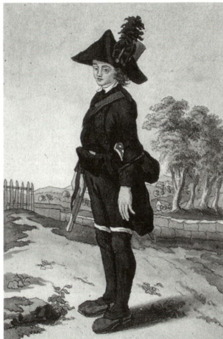
Scharfschütze aus der Stadt Zürich in zeitgenössischer Uniform (1792).

Das Truppenaufgebot gegen das nicht zum gewaltsamen Widerstand bereite Stäfa war massiv und deshalb