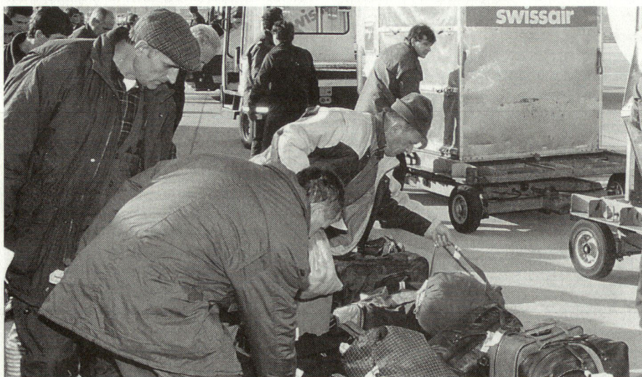
Der Bundesrat hat einem dringlichen Gesuch des UNO-Hochkommissariates für Flüchtlinge (UNHCR) entsprochen, 1500 ehemalige bosnische Kriegsgefangene aus dem kroatischen Transitlager Karlovac kurzfristig aufzunehmen, bis sie auf verschiedene europäische Staaten weiterverteilt werden. Bild: Die bosnischen Flüchtlinge nach ihrer Ankunft am 30. November 1992 auf dem Flughafen Zürich-Kloten.

Für die Verstärkung des GWK sollten grundsätzlich nur Kampftruppen eingesetzt werden, die zudem während ca. 3 bis 4 Tagen u. a. in den Bereichen Anhalten, Durchsuchen, Festhalten, Selbstschutz sowie den fundamentalen Kenntnissen der Grenzvorschriften zusätzlich ausgebildet werden müssen. Bei kontinuierlich hohen Einreisen würden solche Truppen dem GWK für die Geländeüberwachung und die Sicherung an Grenzübergängen zur Zusammenarbeit zugewiesen. Bei eigentlichen Migrationswellen käme auch ein selbständiger Auftrag für den Grenzpolizeidienst im Zwischengelände in Frage. Das zusätzliche Material, mit dem die Truppe für diesen Auftrag ausgerüstet werden müsste (u. a. Nachsichtgeräte, Übermittlungsmittel usw.) würde vom GWK zur Verfügung gestellt und ist zum Teil schon heute vorhanden. ■