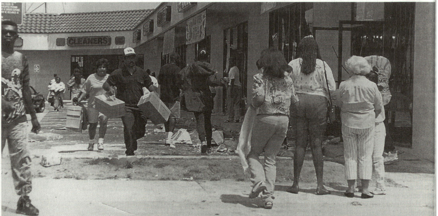
Abb. 1: Nach dem Freispruch von vier Polizisten durch ein kalifornisches Gericht brachen derart massive Krawalle und Plünderungen aus, dass sich der Gouverneur gezwungen sah, die Nationalgarde einzusetzen. Bild: Plünderer beim Ausrauben von Geschäften in Los Angeles am 30. April 1992.

Die Ermittlung der Ausbildungsbedürfnisse für Verbände, die im Bereich Existenzsicherung erfolgreich eingesetzt werden können, folgt nach klarer Ausscheidung der zu lösenden Aufgaben.