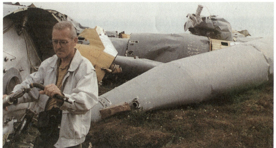
Abgeworfene Stufen von Langstreckenraketen mit giftigen Treibstoffrückständen im Permafrostgebiet Russlands.

Die Entsorgung ist wohl derjenige Schritt im Rüstungszyklus, bei dem in der Vergangenheit die grössten Sünden begangen worden sind. Das Umdenken und der Wandel im Umweltverständnis haben dazu beigetragen, dass manche früher übliche Entsorgungsart heute als katastrophal angesehen wird – und es nicht selten auch ist.