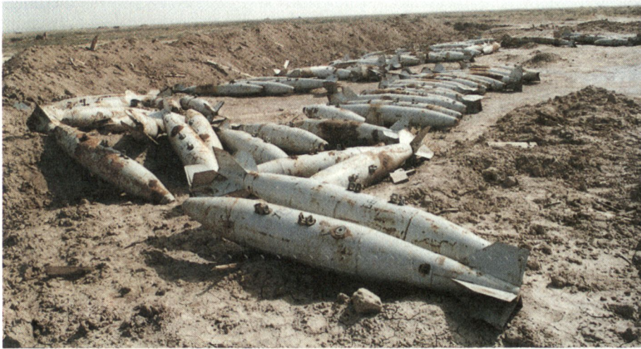
Lecke Yperit-Bomben in der Wüste Iraks.

bei Krasnojarsk. Es liegt auf der Hand, dass solche Produktionsstätten an Flussläufen errichtet worden sind, denn es wird viel Wasser benötigt. Flüsse sind aber häufig auch willkommene und billige Entsorgungsstrassen.