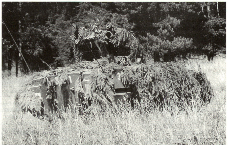
Der Tarnung des Panzerjägers kommt hohe Bedeutung zu. Der Gegner muss überrascht werden. Es darf aber unter keinen Umständen zu einer Duellsituation kommen.

Die gegenseitige Unterstützung der Kompanien bringt erhebliche Vorteile: Know-How-Transfer, Aufteilung der