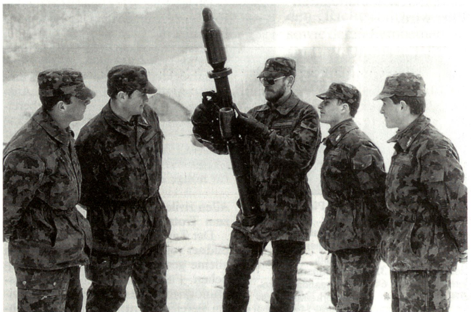
Ausbildung an der Panzerfaust.

bestünde von der siebten Woche an Zeit, unter Leitung der Kompaniekommandanten Übungen im Zugrahmen durchzuführen. Leider finden jedoch bedeutend weniger Zugübungen statt als früher. Krasse Unterbestände sowie Ausbildungslücken sind die häufigsten Ursachen. Ein Training des Kampfes der Verbundenen Waffen bleibt Wunschdenken. Ebenso gehören anspruchsvolle Gefechtsübungen über mehrere Tage in einem dem Rekruten nicht vertrauten Gebiet der Vergangenheit an. Dies stellt auch an die Kader weniger Anforderungen, was vor allem die Qualifizierung der Offiziersanwärter erschwert.