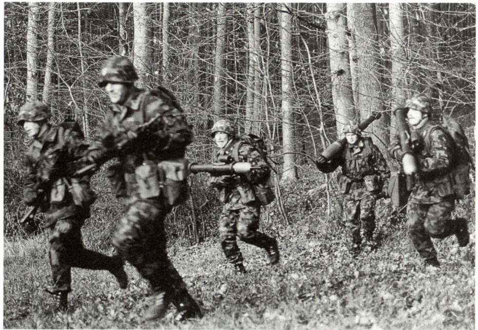
Zugsübung während der Rekrutenschule.

Die schwerwiegendsten Nachteile liegen im Qualifikationswesen: So kommt es vor, dass ein Kompaniekommandant nach vierwöchiger Abwesenheit Unteroffiziere zu qualifizieren hat, die ihm fast völlig unbekannt sind. Die Korporäle stossen erst in der vierten Woche zur Kompanie. In der fünften Woche beginnt bereits die zweiwöchige Spezialistenausbildung, während der die Kompanie praktisch aufgelöst ist. In der sechsten und siebten Woche können die Korporäle vom Kommandanten bei der Arbeit beurteilt werden. In den nächsten vier Wochen befand sich derjenige Kommandant, der die Qualifikationen zu erteilen hatte, auf «Heimurlaub» und hatte danach die Korporäle zu qualifizieren.