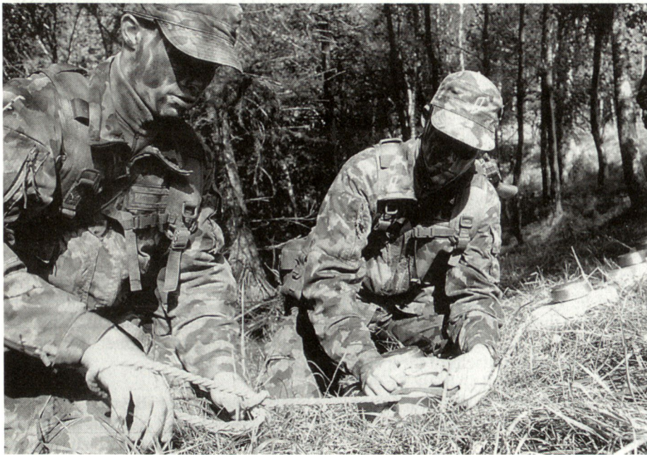
Vorbereiten einer Sperre mit Panzerminen.

über früher keine Fortschritte erzielt wurden. Die Korporäle treten voll motiviert in die Rekrutenschule ein, werden schnell aber auf den Boden der Realität geholt. Sie merken rasch, dass die Rekruten nie einen militärischen Grundschliff (Disziplin) erhielten. Auch ist die Eingliederung der Rekruten in Gruppen zu bewerkstelligen.