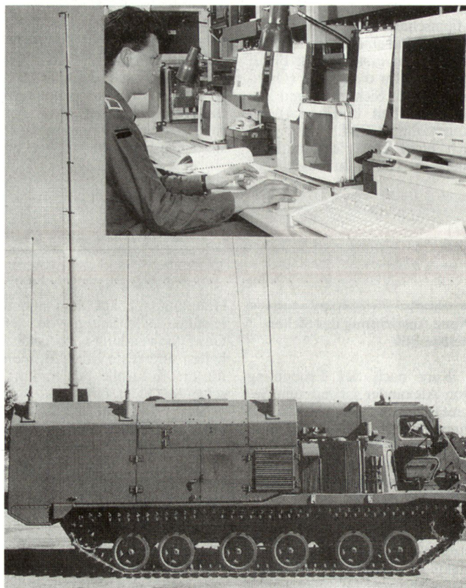
Moderne Mittel für Führung und Übermittlung sind primäre Ziele auf dem künftigen Gefechtsfeld.

laufende Verfolgung der offensiven Informationskriegführung unerlässlich. Schliesslich bleibt die grundsätzliche Frage: Welche Auswirkungen sind auf die Streitkräfte sowie vor allem auch auf die zivilen Führungsorgane zu erwarten? Informationskriegführung erfordert vor allem auch ein Umdenken, d.h. es ist eine neue Art von Kriegführung, bei der einerseits Informationen als Mittel und Waffen dienen, andererseits die eigenen Informations- und Entscheidungsorgane sowie die diesbezüglichen automatisierten Strukturen speziell gefährdet sind. hg ■