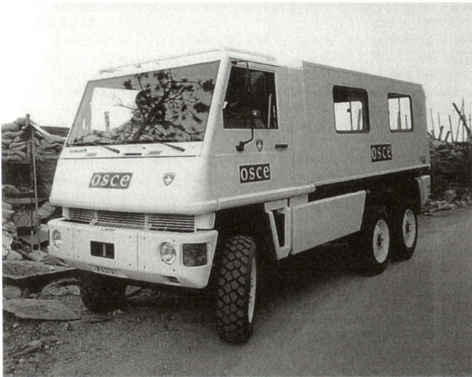
Geländefahrzeug «Duro» in OSZE-Diensten.

Friedensmission in Bosnien für die Zeit der Schweizer OSZE-Präsidentschaft ein Geländefahrzeug vom Typ «Duro» kostenlos zur Verfügung gestellt.