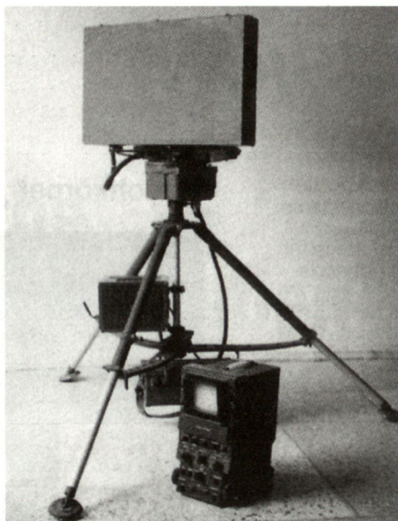
Das russische Gefechtsfeldüberwachungsradar RP-200 «Credo-1» wird heute zusammen mit anderen Aufklärungsgeräten zum Verkauf angeboten.