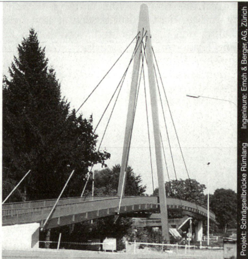
Projekt: Schrägseilbrücke Rümbling Ingenieure: Emoh & Berger AG, Zürich

Nur mit diesem Baustoff sind die grössten Spannweiten und Höhen möglich, dies mit Berücksichtigung der Wirtschaftlichkeit und des vorteilhaften Leistungsgewichtes. Stahl bietet eine nahezu unerschöpfliche Fülle von Möglichkeiten, Ihre Ideen zu verwirklichen.