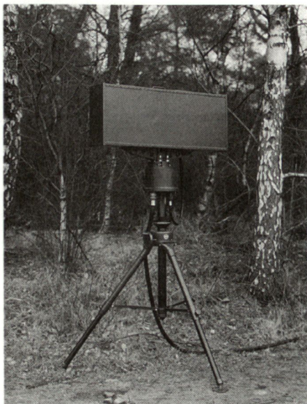
Das tragbare Gefechtsfeldüberwachungsradar «Scout», entwickelt durch die holländische Firma Signaal, ist ein Beispiel der Neuentwicklungen in diesem Bereich.

Genutzt werden Gefechtsfeldüberwachungsradars im wesentlichen für folgende Aufgaben: