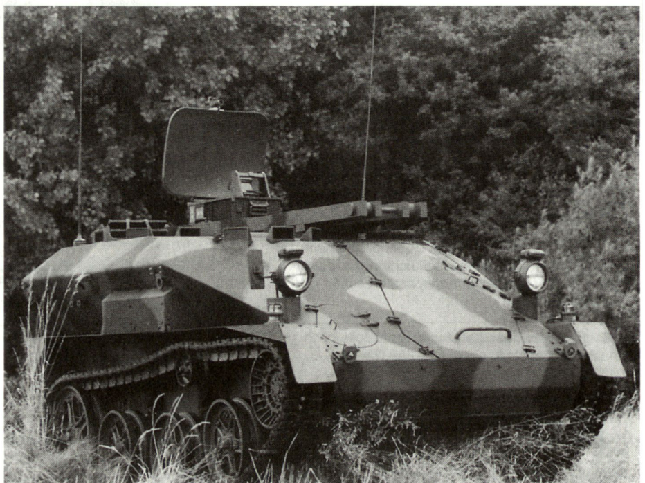
Prototyp des mobilen Überwachungsradars «Ratac-S» auf dem Luftlandpanzer «Wiesel».

Die Entwicklungsschwerpunkte liegen heute bei leichten Überwachungsradargeräten, die je nach Bedürfnis ab Fahrzeugen oder auch als tragbare Versionen abgesetzt verwendet werden können. Die maximale Erfassungsbereichweite moderner Geräte liegt je nach Einsatzverfahren zwischen etwa 10 und 20 km. Die Leistungsfähigkeit von Radargeräten hängt aber in hohem Masse von der Geländebeschaffenheit, den Witterungsbedingungen sowie von der Grösse der jeweiligen Ziele ab. So liegt die Erfassungsbereichweite für Personen in der Regel weit unter 10 km.