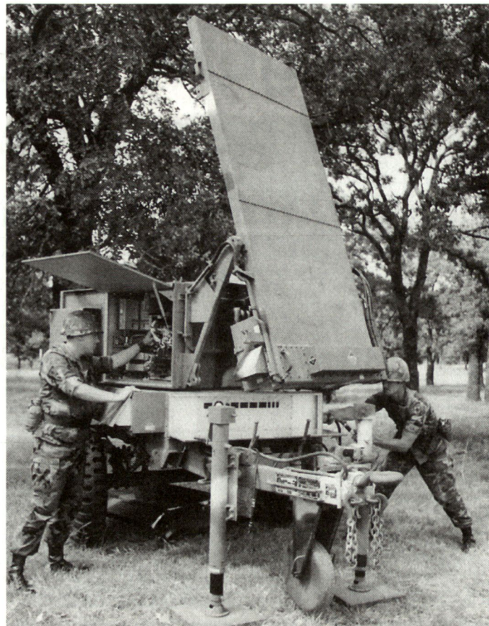
Artillerieradar AN/TPQ-36 «Firefinder» der US-Army. Einige dieser Systeme stehen bei den amerikanischen IFOR-Truppen in Bosnien im Einsatz.