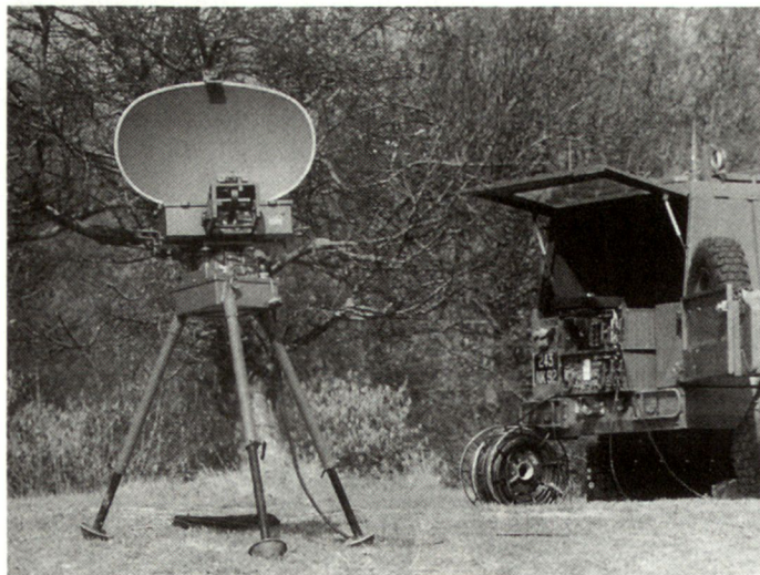
Versionen des Radargerätes «Rasit» stehen heute in nahezu 20 Armeen im Einsatz.

Die zunehmenden Informationsbedürfnisse, insbesondere im Zusammen-