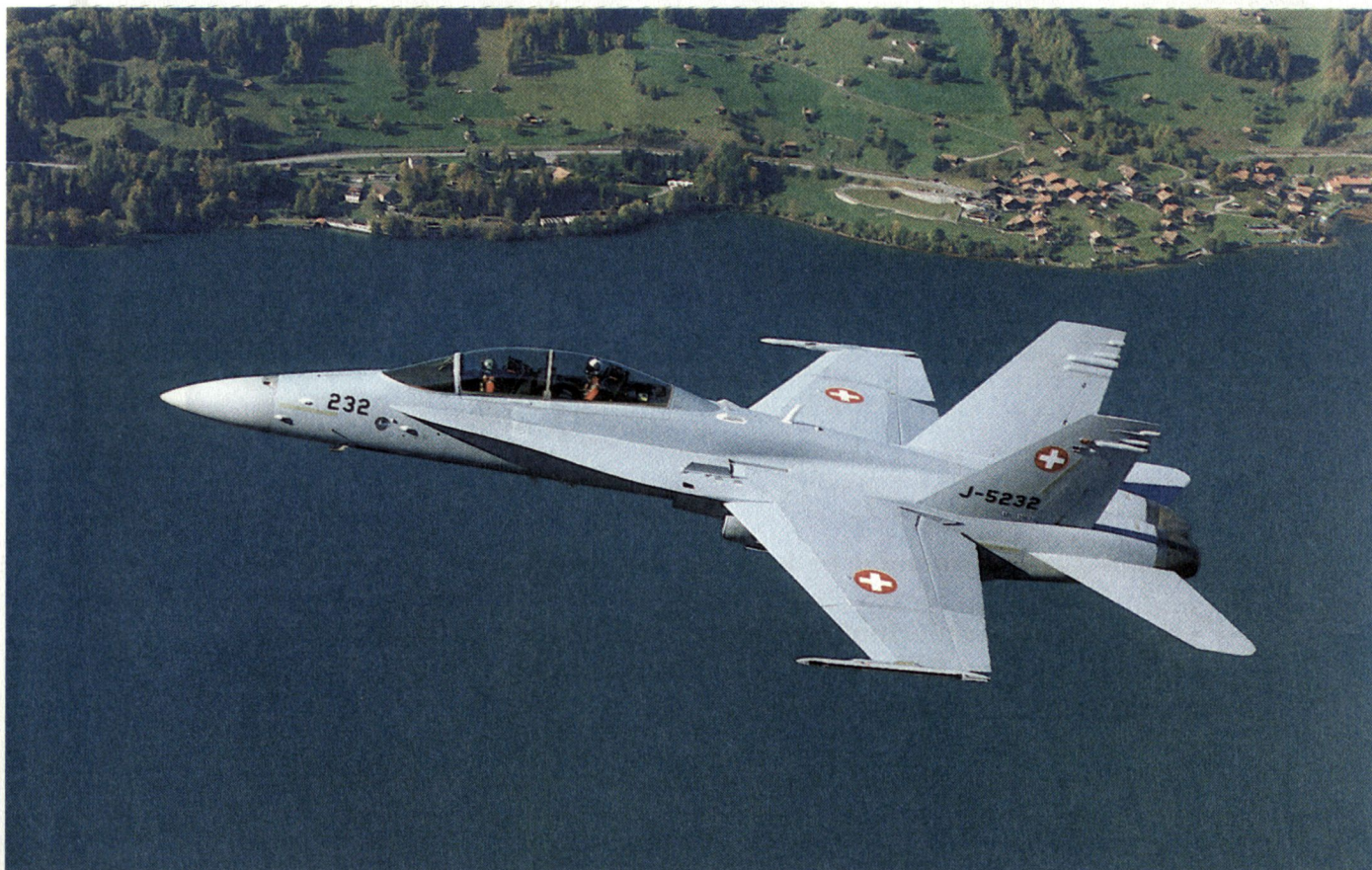
Erstflug F/A-18D «Hornet» über dem Brienersee.

Der Programmkostenverlauf ist gut; die im bewilligten Verpflichtungskredit ausgewiesene Risikoreserve ist bisher unangetastet.