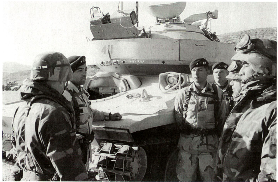
Besuch des «National Training Center» in Fort Irvin (Kalifornien): Studenten des National War College im Gespräch mit der Besatzung eines M551-«Sheridan»-Kampfpanzeres.

Vormittags führen Vorlesungen namhafter Referenten aus Politik, Militär oder Wirtschaft in die einzelnen Themen der Kurse ein. Vierzehn Seminargruppen von je zwölf bis dreizehn Studenten (darunter je ein Ausländer) behandeln anschliessend den Stoff vertieft, wobei oft Gäste zugegen sind. Nur wenige Vorlesungen sind aus Klassifikationsgründen für Ausländer nicht zugänglich.