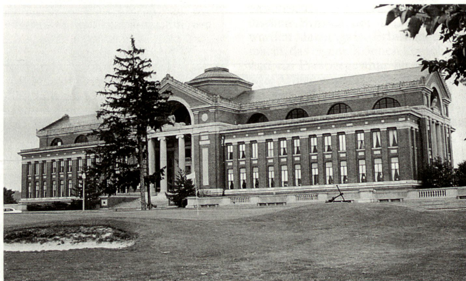
Das National War College ist in der Theodore Roosevelt Hall untergebracht und liegt wunderschön gelegen in Washington D.C.