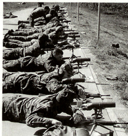
Kurze Atempause vor dem Präzisions-schiessen mit dem G3.

Im August 1996 sollte sich zeigen, dass sich die intensiven Vorbereitungsarbeiten gelohnt hatten.