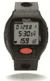
Polar Accurex Plus™