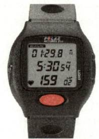
Polar Accurex Plus™