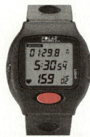
Polar Accurex Plus™