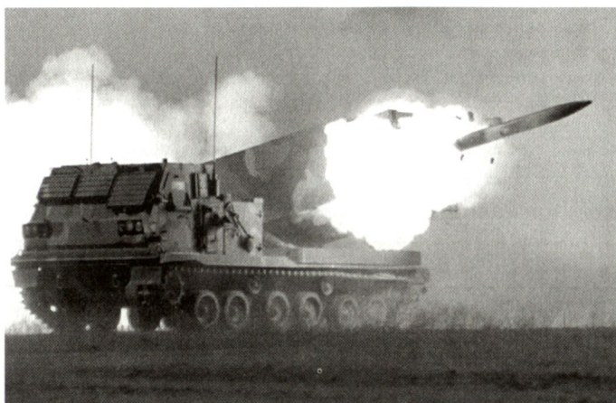
Mehrfachraketenwerfer MLRS für das dänische Heer.