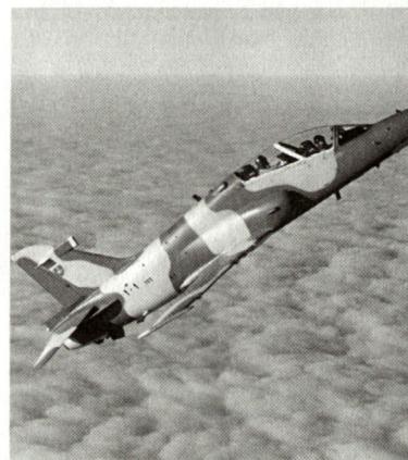
Die australische Luftwaffe hat sich für den Kauf von Trainingsflugzeugen Hawk-100 entschieden.

In einer weiteren Ausbaustufe möchten die australischen Streitkräfte Frühwarn-Radarflugzeuge beschaffen. Aus diesem Grund wurden bei den amerikanischen Firmen Boeing, Lockheed Martin, Northrop Grumman sowie Raytheon-ESystems Offerten eingeholt. Northrop Grumman haben sich zu diesem Zweck mit Lockheed Martin zusammengeschlossen und sehen als kostengünstige Lösung den Einbau des Überwachungsradars APS-145 in eine Transportmaschine C-130 J vor. Die australische Luftwaffe hat bereits einige dieser Transportflugzeuge bestellt. Boeing wiederum möchte das Überwachungsradar in einem Linienflugzeug Boeing 767 integrieren. Zurzeit liefert Boeing solche AWACS-Flugzeuge an Japan aus, die eine verbesserte Überwachung des Pazifikraums anstreben. RCB ■