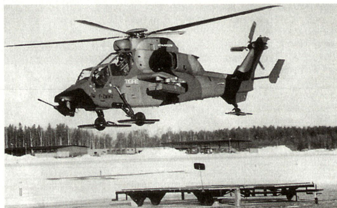
Kampfhelikopter «Tiger» von Eurocopter anlässlich Truppenversuchen in Schweden.

Die langfristige Beschaffungsplanung Schwedens sieht die Aufstellung eines Kampfhelikopterbataillons innerhalb der nächsten 10 Jahre vor. Gemäss vorliegenden Erkenntnissen soll der definitive Typenentscheid allerdings erst nach dem Jahre