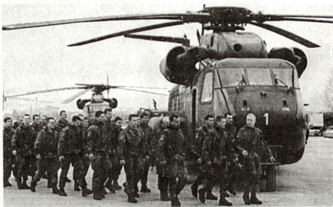
Erfolgreiche Rettungsaktion durch Deutsche in Albanien.

erwidern. Die präzise Durchführung ist der sorgfältigen Planung zu verdanken, besonders durch die umsichtige Einbezie-