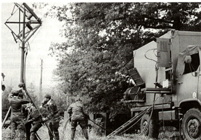
Bei SIR und SIC wird auf dem System RITA (Réseau Intégré de Transmission Automatique) basiert.

Frankreich konzentriert sich auf Systeme «Crécerelle» und «Brevel». Grossbritannien entwickelt die Beobachtungsdrohne «Phoenix» für das Jahr 1999. Die Niederlande wollen vier Batterien à 8 Beobachtungsdrohnen «Sperwer» mit 90 km Reichweite und 4 Stunden Autonomie beschaffen. Schweden arbeitet mit Ericsson und Grumman zusammen, um das Radarsystem «Carabas-2» zu entwickeln, das bis in 10000 m Höhe verwendet werden kann. Belgien will sein System «Epervier» ersetzen, und Italien arbeitet am eigenen System «Vista». Für Marinezwecke ist die Verwendung von Drohnen zur