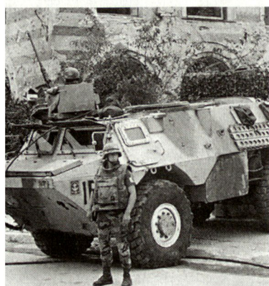
Bei Landstreitkräften zeichnet sich ein zunehmendes Bedürfnis nach multifunktionalen Transportschützenpanzern ab. (Bild: Französischer Radschützenpanzer VAB in Bosnien-Herzegowina).

Aufbauend auf dem taktischen Konzept soll je eine Lösung (Grundfahrzeug) mit Rad- und Raupenfahrgestell entwickelt werden. Das Bestreben, möglichst preiswerte multifunktionale Fahrzeugversionen zu produzieren, erfordert neue Konzeptionen mit modularem Aufbau. Verwendungszweck, Schutzfaktoren sowie die logistischen und infrastrukturellen Anforderungen müssen auf die aktuellen Bedürfnisse und multinationalen Aufgaben abgestimmt sein. Unterdessen soll sich bereits ein leichter Vorteil für die Radversion herausgestellt haben. Das bisher definierte Programm sieht zwei gemeinsame multinationale Versionen, einen Gruppentransportpanzer