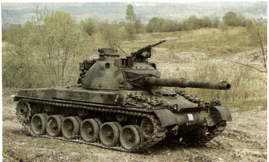
Panzer 68/88: Ein Kampfpanzer, der immer wieder durch hervorragende Trefferresultate überrascht.