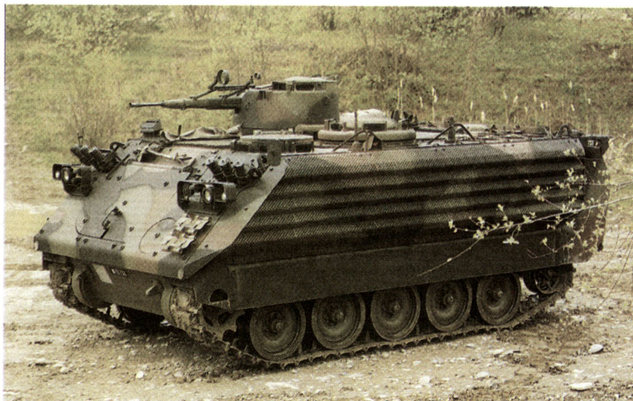
Schützenpanzer 63/89: Unverwüstliche Technik amerikanischer Provenienz.

Die Antwort kann meines Erachtens nicht entschieden genug ausfallen: Je komplexer und anspruchsvoller ein Waffensystem ist, desto wichtiger ist der kontinuierliche Aufbau des Kriegsgenügens in Friedenszeiten. Zu meinen, wir könnten in wenigen Monaten beschaffen und ausbilden, was über Jahre vernachlässigt wurde, ist ein fataler Irrtum. Die historischen Lehren des Kriegsjahres 1939 sprechen hier eine zu deutliche Sprache. Sie sind uns Verpflichtung und Warnung zugleich.