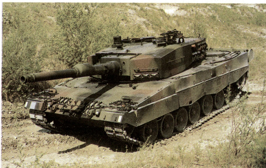
Panzer 87 «Leopard 2»: Einer der besten Kampfpanzer der Welt.