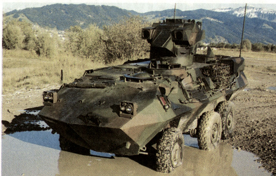
Panzerjäger 90: Das langarmige Hohlladungsgeschoss muss das Wuchtgeschoss des Kampfpanzers überlagern.