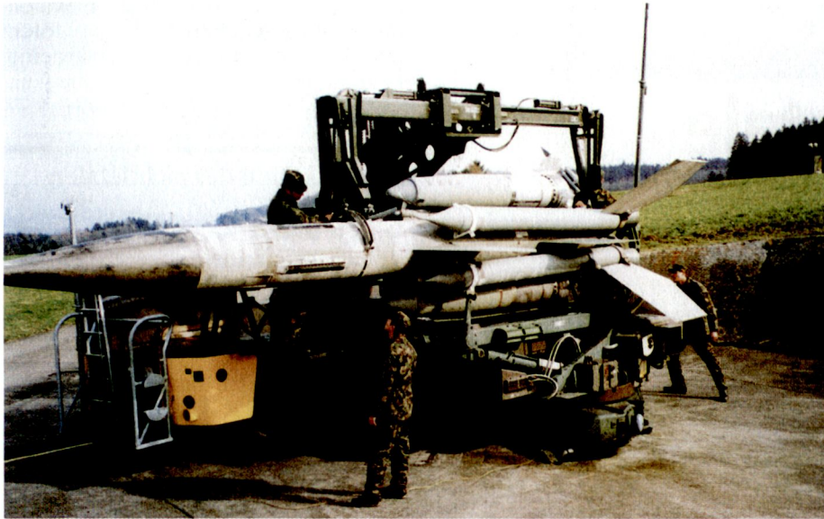
Werfermannschaft beim Laden einer Lenkwaffe.