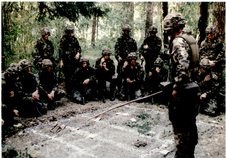
Der Grenadier-Zugführer befiehlt den Zugseinsatz dem ganzen Zug am Geländemodell. Foto: Wm Andy Weber, Gren Kp 24 ■

Der junge Soldat aller Stufen rückt mit einer bemerkenswerten Motivation in den Dienst ein. Er will gefördert werden. Deshalb, in erster Linie aber um der Sache willen, sind ihm Armee und Kader schuldig, optimale Rahmenbedingungen für die Ausbildung zu schaffen. Bevor dies erreicht ist, liegt immenses menschliches Kapital brach. Die vorstehenden Zeilen tragen hoffentlich zur Verbesserung der Rahmenbedingungen bei. Die Zeit des Umbruchs bietet in diesem Sinne grosse Möglichkeiten. Im herrschenden politischen Umfeld liegt es vor allem bei der Armeeführung, diese Chancen tatkräftig anzupacken. Wir hoffen darauf!