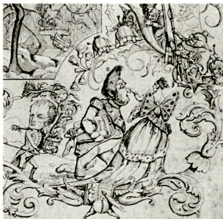
Die Rolle Grossbritanniens und Frankreichs in der Sonderbundskrise.

Jetzt war es der preussische König Wilhelm IV., der eine Vermittlungskonferenz in sein Fürstentum Neuchâtel vorschlug. Metternich und Guizot unterstützten ihn sofort. Die besetzten Kantone sollten unverzüglich geräumt,