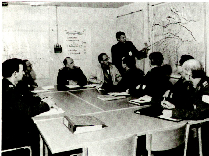
Ter-Kreis und KFS: gemeinsame Verantwortung bedingt gemeinsame Beurteilung...

emporgearbeitet. Aus dem ehemals blauen Zwitter wurde ein feldgrauer Partner mit Waffenstolz und Effizienz. Ob er nun dem Kanton zugewiesen oder in der Hand des Zonenkommandanten eingesetzt wird, das ändert nichts an der Tatsache, dass diese Truppe hinter der Front immer zuvorderst anzutreffen ist. Damit wird sie zur soliden und verlässlichen Stütze realisierter Gesamtverteidigung.