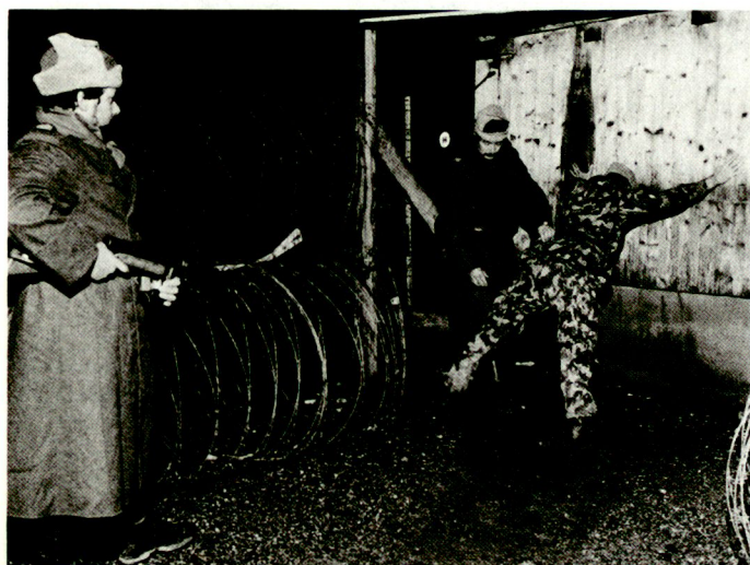
Misstrauen und Sorgfalt schützen vor bösen Überraschungen ...