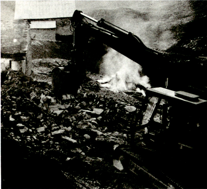
Die Armee stellt geeignetes Material, Maschinen und Geräte zur Verfügung ...