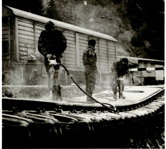
Einsatz von Spezialisten mit ihrer beruflichen Erfahrung ...