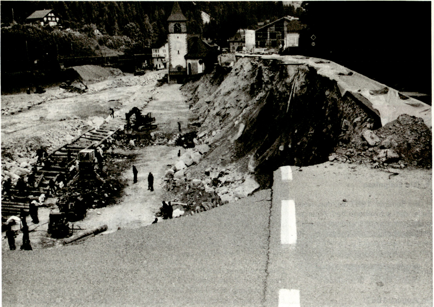
Eine grosse Schadenlage erfordert den Einsatz mehrerer Baumaschinen und vieler Wehrmänner einer Ls Kp ...

durch ungewisse, gefährliche Verkettungen von Ereignissen und Zuständen geprägt, welche ohne Vorwarnzeit alle Lebensbereiche erfassen. Im Sinne der Gesamtverteidigung ist eine Katastrophe ein unvorhergesehenes Ereignis, das sehr viele Opfer und/oder Schäden verursacht, das die vorhandenen personellen und materiellen Mittel der betroffenen Gemeinschaft überfordert, wobei zusätzliche unmittelbare Hilfe notwendig wird.